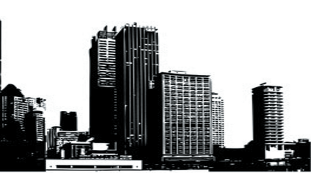
★西王庄镇普通村(居):刘耀村

“适应新常态,开创新局面,全面建设活力、生态、宜居的特色乡镇”的奋斗目标已经明确,在区委、区政府的正确领导下,西王庄人正以“食不甘味”、“寝不安席”的责任感与紧迫感,以“抓铁有痕、踏石留印”的劲头和决心,以“气势、智慧、坚忍、严谨”的西王庄作风,以“攻坚克难、敢打必胜、勇往直前”的西王庄精神奋力推进西王庄镇经济社会快速健康发展迈向新阶段!