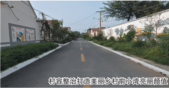
村容整治打造美丽乡村前小湾亮丽颜值