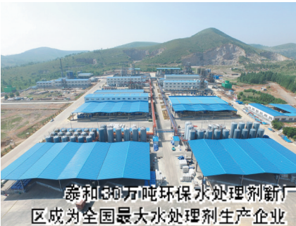
泰和30万吨吨环保水处理剂新厂区成为全国最大水处理剂生产企业