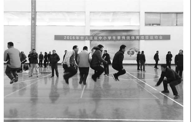
年末岁首,很多体育爱好者通过运动来辞旧迎新,成为冬日里一道靓丽的风景。上图为市游泳管理中心冬泳爱好者寒冬里戏水。下图为台儿庄区中小学生冬季传统体育项目比赛现场。