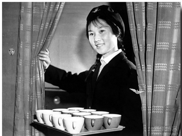
由“红装裹身”的高武风尚向中性化过渡