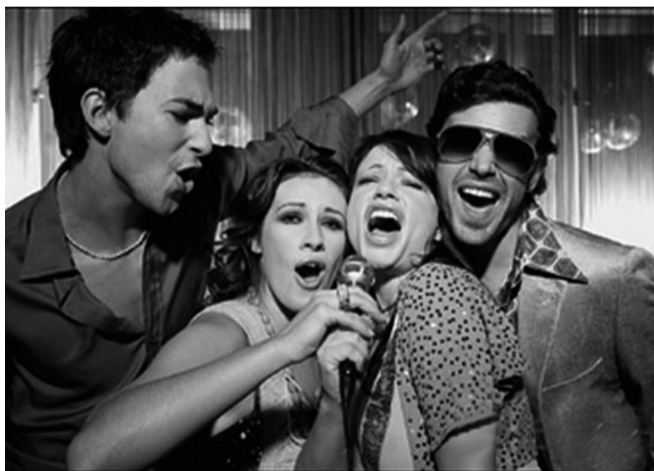
1974年已经出现流行穿大尖领子的衣服