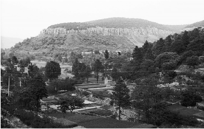
115师司令部机关驻地——抱犊崮山区葫芦套村

115师进入鲁南山区后,首先拔除了由枣庄伸向抱犊崮山区的白山、上下石河等日伪据点,又打垮了一些勾结敌伪的