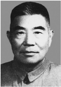
张光中 曾任中共苏鲁边区临时特委委员、苏鲁人民抗日义勇队第一总队队长、苏鲁支队支队长。

在土地革命战争时期,山亭区境内共发展党员82名。由于地下党广泛地开展群众工作,在山区传播了革命思想,播下了革命的火种,为后来党组织和革命事业的发展壮大,创建根据地承担抗日战争和解放战争的艰苦考验,奠定了可靠的基础。