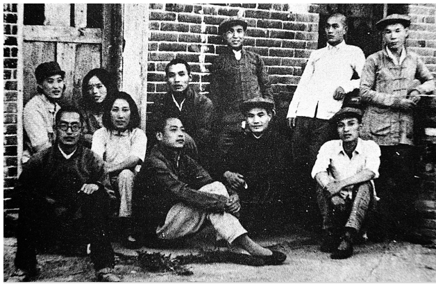
1946年7月,鲁南各教会工作队到滕县苏家庄乡搞土改试点时留影。