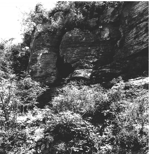
大北庄党支部诞生地——牛鼻子洞