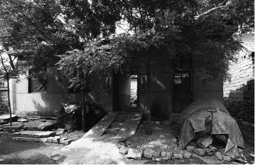
徐庄元德堂药店旧址(已翻新)