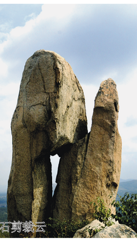
石剪裁云 莲青山位于山亭、邹城、滕州三地交界处的山亭区店子镇,总面积约2400公顷,由大小百座山头组成,主峰为摩天岭,海拔603米,是鲁南地区的第二高峰,主峰处有一巨石,自然开裂,形如莲花,被四