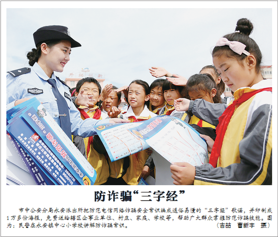
市中公安分局永安派出所把防范电信网络诈骗安全常识编成通俗易懂的“三字经”歌谣,并印制成1万多份海报,免费送给辖区企事业单位、村庄、家庭、学校等,帮助广大群众掌握防范诈骗技能。图为:民警在永安镇中心小学校讲解防诈骗常识。

瀑布之下,便是龙床峡谷,绵延2500米,迂回曲折六道弯,瀑布由此而下,直奔峰城大沙河。峰座峡谷变化奇妙、峰回路转、曲径通幽,峡谷两岸奇石林立、鸟鸣低谷。两岸花果飘香、景色怡人,是人们休闲的理想去处。