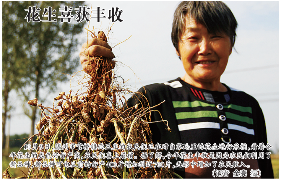
10月9日,滕州市官桥镇西庄的农民们正在对自家地里花生进行采摘,看着今年花生的成色好亩产高,农民们喜上眉梢。据了解,今年花生丰收是因为农民们引用了新品种,新品种亩产从以前的亩产400斤增加到近700斤,无形中增加了农民收入。