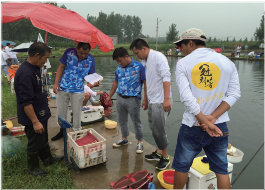
现场称量选手所钓鱼的重量

8月6日早晨6时29分许,56名参赛者齐聚户主水库,有序地进入赛场,按照抽签的次序就坐等待吹哨开始钓鱼。据裁判员说,此次钓鱼比赛,共计四场,这是最后一场总决赛。前三场分别于7月17日、7月23日、7月30日举行完毕,每场60人对决,从第一场到现在已经角逐到56人最终参加总决赛,可以说,比赛还是比较紧张激烈的。裁判长说,竞赛规则非常标准,是按照国家钓鱼比赛章程规定参考执行的,如用竿长度限制,线组长度的规定,以钓混合鱼重量为准(有效鱼为鲫鱼、鲤鱼、草鱼、鳊鱼),其它鱼种为无效鱼等等。 在现场,垂钓爱好者挥杆逸情,休闲竞技。据花冠集团滕州区域总经理侯永东介绍,目前随着生活水平的提高,热爱垂钓的群体越来越大,涉及各个不同领域的人,有的甚至是一些领导干部、企业家等。今天参加比赛的选手都在不同的岗位,有个体、企业、单位等等,他们当中既有长期热衷于垂钓活动、技艺高超的老手,也有初次参赛的新手。记者看到,垂钓老手们挂饵、抛线、放钩等动作一气呵成,精准熟练,新手们动作虽不娴熟,但热情洋溢,乐在其中。当天