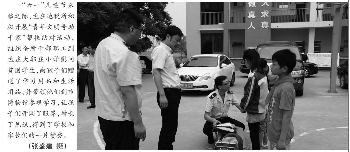
“六一”儿童节来临之际,孟庄地税所积极开展“青年文明号助千家”帮扶结对活动,组织全所干部职工到孟庄大郭庄小学慰问贫困学生,向孩子们赠送了学习用品和生活用品,并带领他们到市博物馆参观学习,让孩子们开阔了眼界,增长了见识,得到了学校和家长们的一片赞誉。