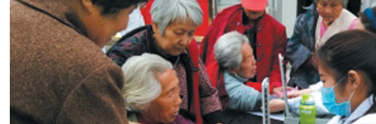
近日，滕州市北辛社区卫生服务中心公共卫生“大篷车”为社区65岁以上的老年人进行免费健康体检和生活方式指导，受到居民一致好评。据统计，该中心已为7.8万居民建立了健康档案，高血压、糖尿病等慢病管理6610余人，共为居民节省查体费用400余万元。