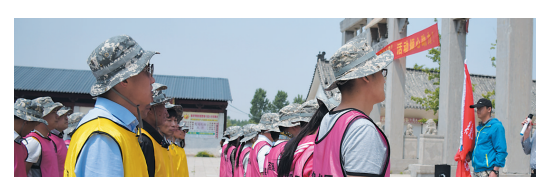
护士节前夕，滕州市精神卫生中心全体医护人员分两批，赴蓬青山拓展训练。克服员工职业倦怠，舒缓职场压力，焕发工作热情，进一步提升医院中层管理人员的管理意识与管理能力，增强医院团队协作意识及团队凝聚力。