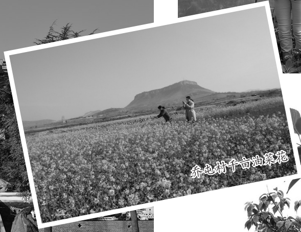
齐村千亩油菜花海