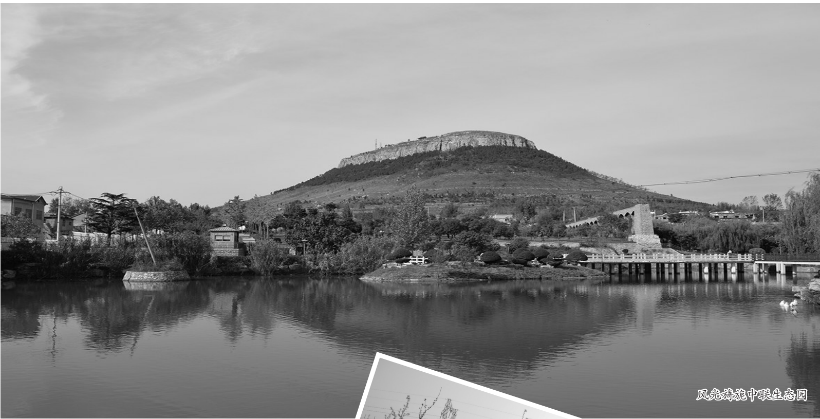
风光旖旎中联生态园

齐村镇有着良好的地理位置和优越的区位优势,镇党委政府审时度势,下步将着重以道路建设为纽带,不断推动城镇化进程。依托交通区位优势,繁荣商贸物流业。充分利用土地资源,因地制宜发展商贸、地产服务业,加快推进东西北外环以内新农村建设改造步伐,努力实现东西北外环以内全面城镇化。以区位优势促发展,构建新型工业带。争取一批科技含量高、产业关联度大、回报力强、积聚效益明显的工业企业落户此地,为齐村的腾飞发展注入强大的活力。依托东北部自然资源,开发城市旅游带。在北部山区大力发展近郊游、乡村游、采摘游,依托甘泉寺、凤凰城堡、钓鱼台、夹谷山、云谷山等著名景点,着力打造绿色生态齐村、泉水花乡、人间天堂,实现北郊园林与抱犊崮旅游地带的衔接。同时,利用北部山区依山傍水的良好条件,重点发展养老、养生产业,打造市中的后花园。