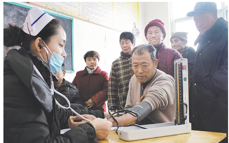
1月6日,天气虽冷,滕州市东官庄村的村委会大院里却热闹非凡。滕州市矿山医院组织十多名医护人员来到该村为200余名村民进行义诊服务,受到了村民们的欢迎。