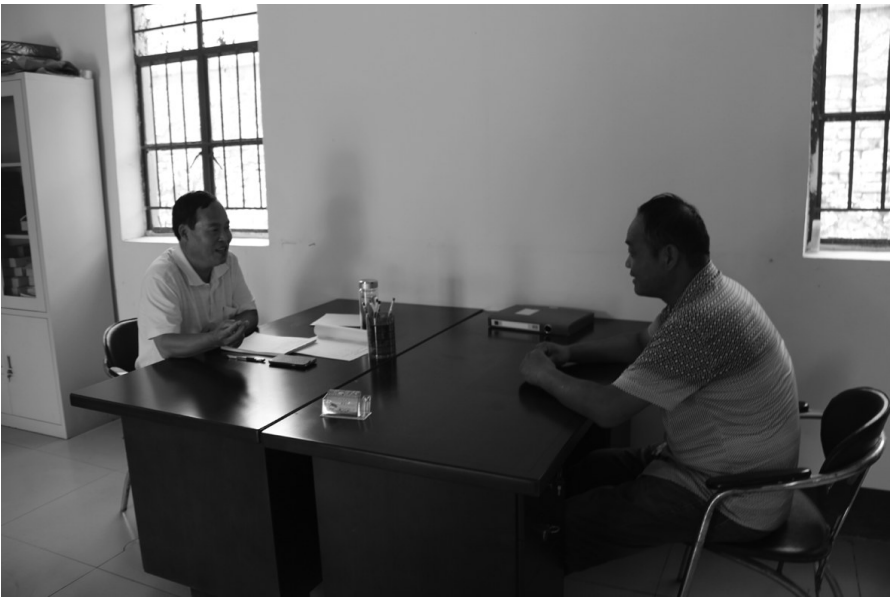
开展村级人大代表接待活动