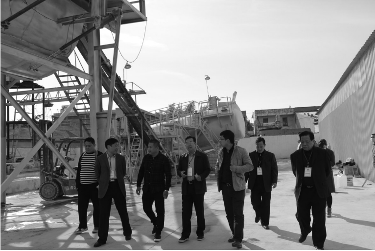
人大代表视察环保事业