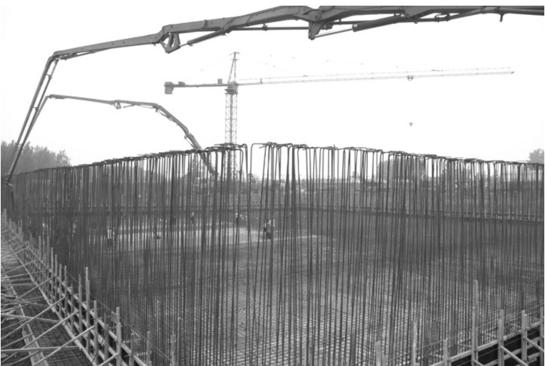
落实代表建议建设镇污水处理厂