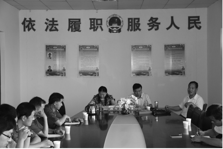
开展区级人大代表接待活动

深入开展“创先争优”活动，突出代表模范作用。紧紧围绕实体经济发展及“六个市中”建设，引导代表立足本职、带头实干，在各自领域争当模范、争做表率、争立新功，并以此作为代表年度考核的重要指标，激励代表身体力行推动科学发展。今年以来，通过代表创先争优、扎实工作，全镇共新上实体经济项目13个、惠及民生项目18个，为群众办理实事好事130余件，充分发挥了人大代表在选民群众中的模范带头作用。