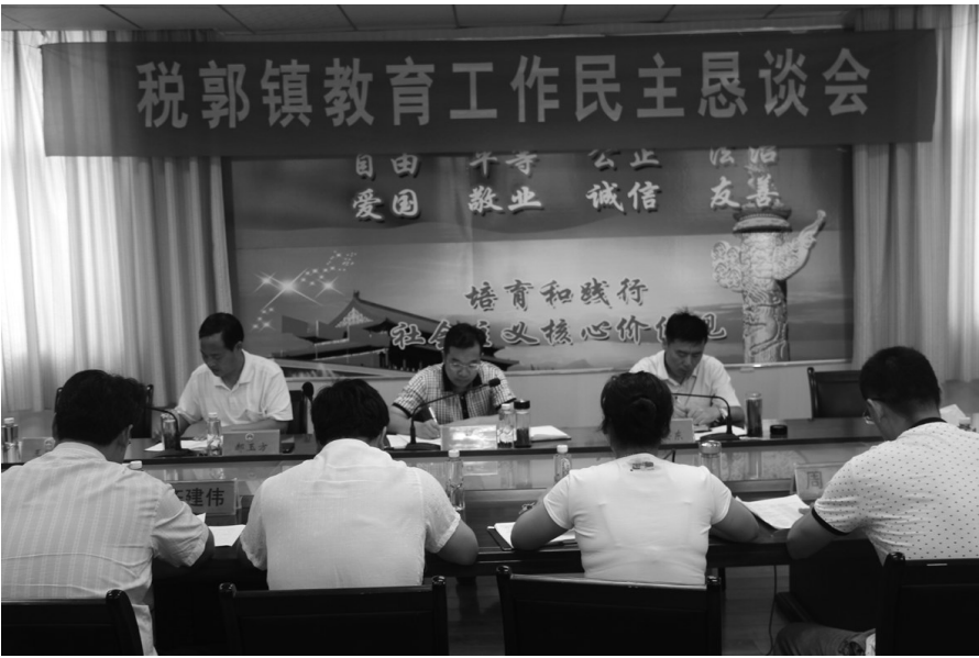
人大代表视察农产品安全

今年以来，市人大代表第四小组、税郭镇代表小组坚持将“人大代表履职绩效提升年”活动作为人大工作的有力抓手，严格按照区人大的活动要求，精心组织，狠抓落实，推动了活动的平稳顺利开展，取得了明显的活动成效。