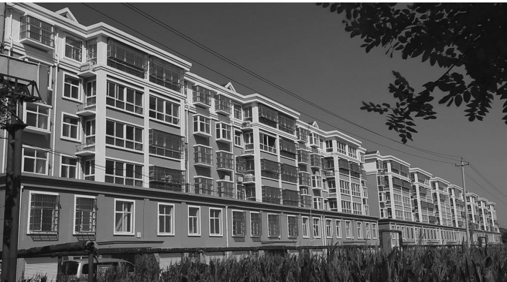
落实建议建设沙沟新村