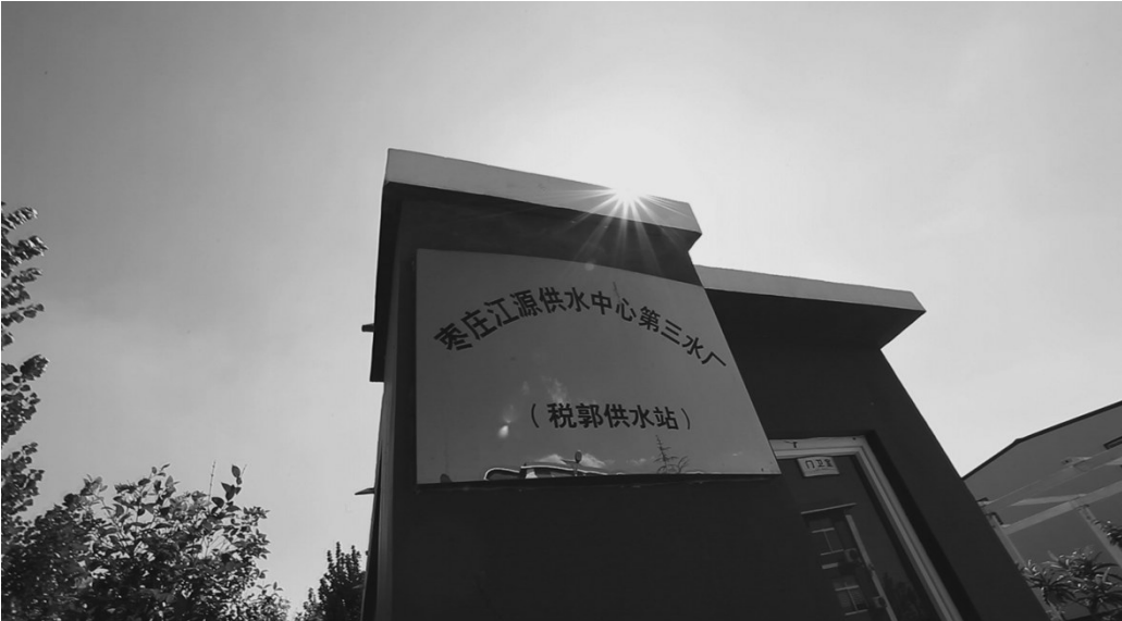
落实代表建议建设税郭水厂