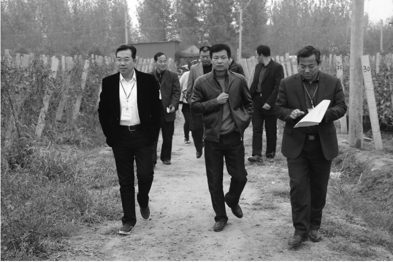
人大代表视察农产品安全