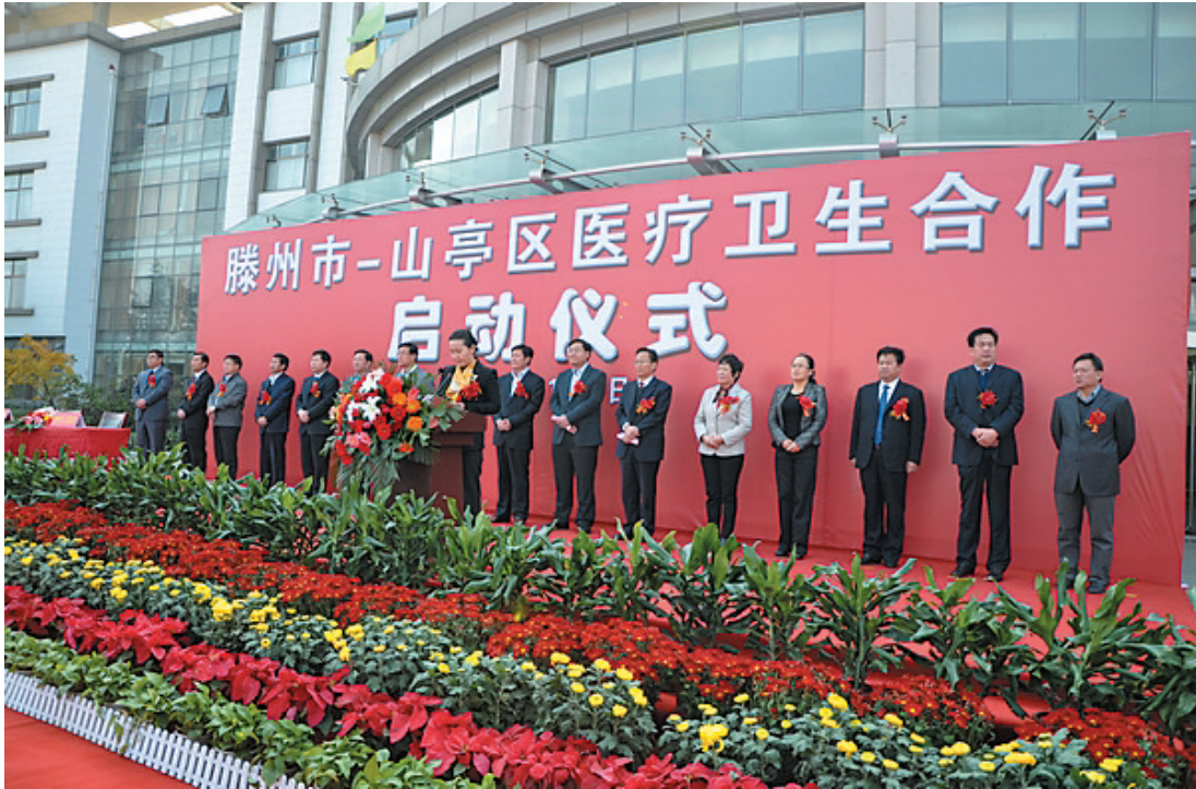
滕山医疗卫生区域合作仪式