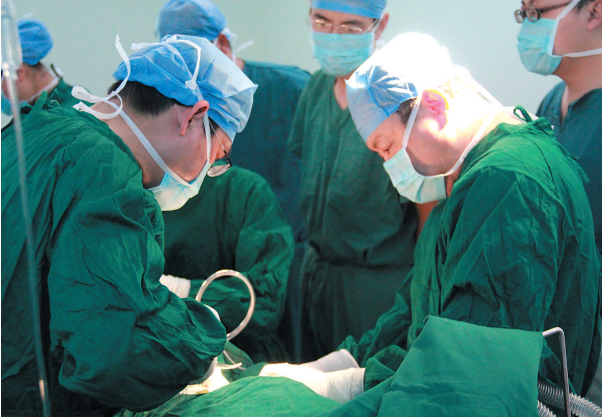
林峰山滕合作经骨平台骨折复位手术