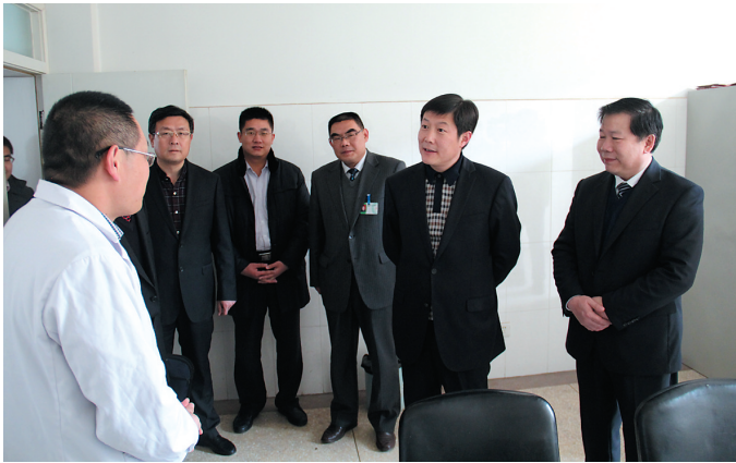
时任山亭区委书记王常胜(现任市委常委、组织部长)到医院调研

长风破浪会有时，直挂云帆济沧海。如今的山亭区人民医院，正信心满满，与滕州市中心医院携手并进，向着温馨祥和的、品牌化、现代化、区域化医院跨越，为老百姓送去更多的健康福音！