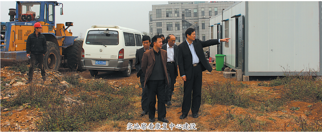
实地察看康复中心建设