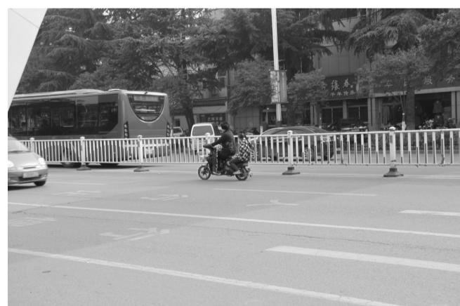
地点:光明路 图片说明:电动车占道逆行