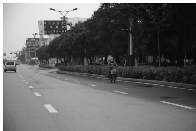
地点:光明路 图片说明:电动车逆行