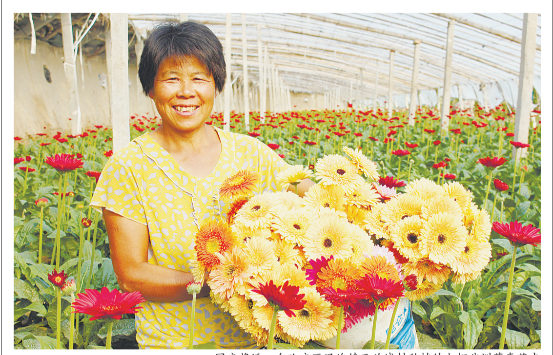
大棚菊喜上市 国庆将近,台儿庄区泥沟镇西兰城村种植的大棚非洲菊喜获丰收,农民们采摘包装后空运到北京、上海等地,为节日市场增添了喜庆气氛。图为农民在采摘大棚菊。

滕州讯 为进一步增强全员质量意识和市场危急意识,切实提高产品质量管理水平,9月份以来,滕州卷烟厂以“提升质量意识、强化质量责任、建设质量强企”为主题,深入开展2015年“质量月”活动。在质量月活动中,该厂通过开展质量征文、技能比武、“产品质量小故事”征集、质量知识竞赛以及质量先进评比等一系列活动,增强全体职工的质量责任意识,树立“质量是企业的生命,责任是质量的保证”观念,全力唱响质量兴企、强企的主旋律。各车间针对总体要求和安排,纷纷通过多种形式扎实开展“质量月”活动,截至目前共收到“质量金点子”147个;制丝车间利用“质量月”专题展板、条幅、大屏幕投影等多手段积极宣传,并组织员工在质量承诺板上签字,增强全体职工的质量责任意识。(杨博)