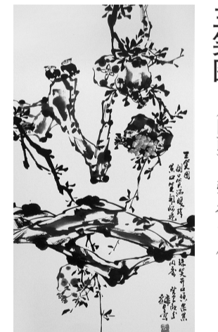
三笑图 (国画) 张泰昌 作