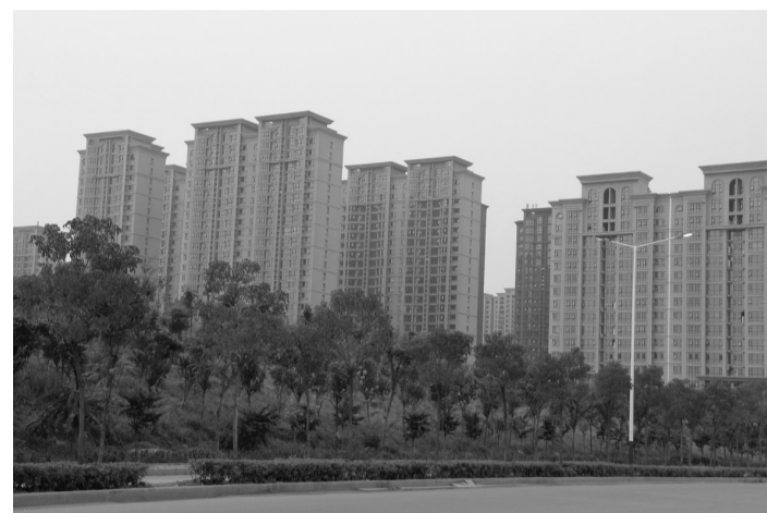
衡山路两侧道路绿化