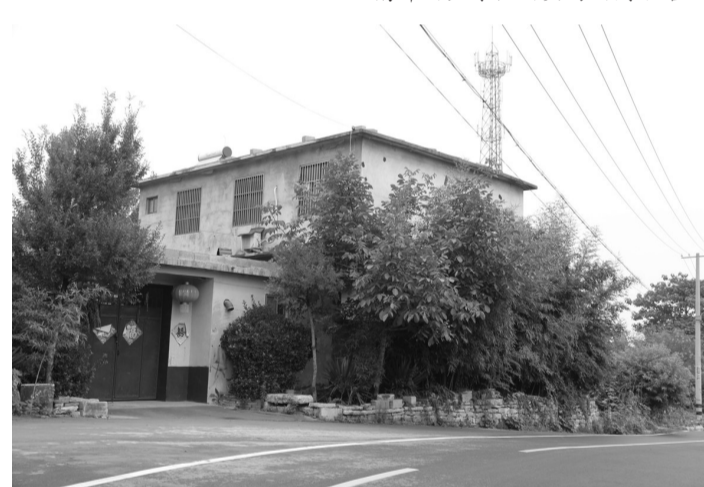
薄板泉村绿道口绿化