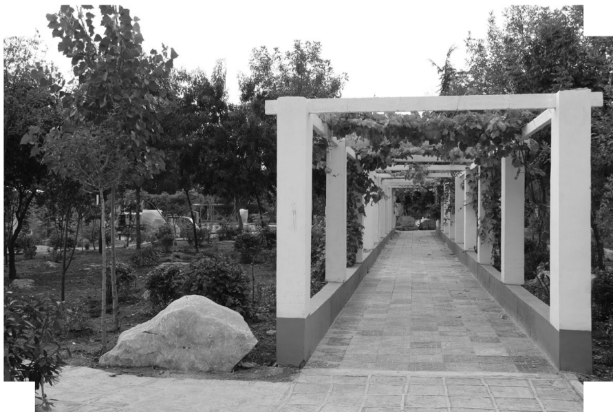
马庄社区花园绿化