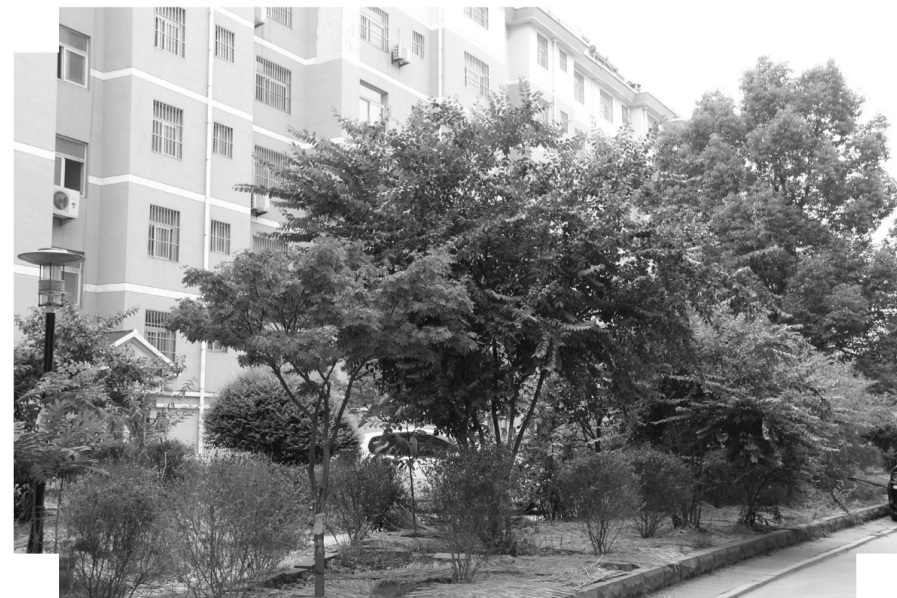
金榜家园小区绿化补植