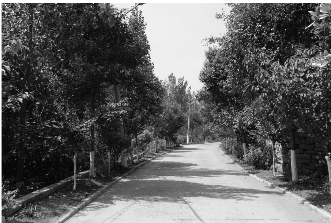
南部山区车峪村道路绿化

永安镇地处城乡结合部位,城市拆迁、重点工程建设等造成裸露土地和闲置土地较多,裸露土地一度达3150亩,资金少、任务重、时间紧成为永安镇开展园林绿化工作的障碍。今年以来,永安镇多次召开党委扩大会议,专题研究园林绿化工作,成立了以镇长为组长、人大副主任为副组长、相关科级干部共同靠上帮包的领导小组,领导小组下设办公室,执法、乡建、林业、规划、财政等部门全员靠上,全力完成永安镇的园林绿化任务。截至目前,该镇已累计完成投资300余万元、栽植各类苗木4.5万棵、增加绿地面积2000亩,新建和维修游园三个,补植完善背街小巷5条,完善小区绿化14个,全镇绿化率得到全面提升。