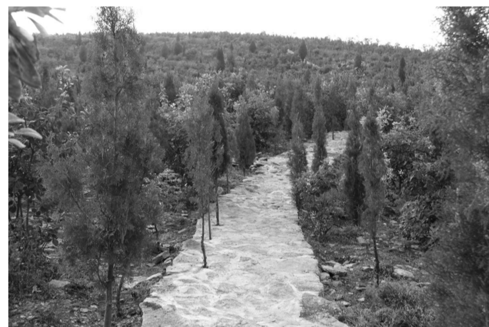
南部山区绿化山头的山间小路