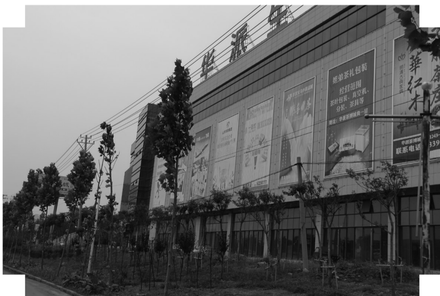
华派生活馆西侧道路绿化补植