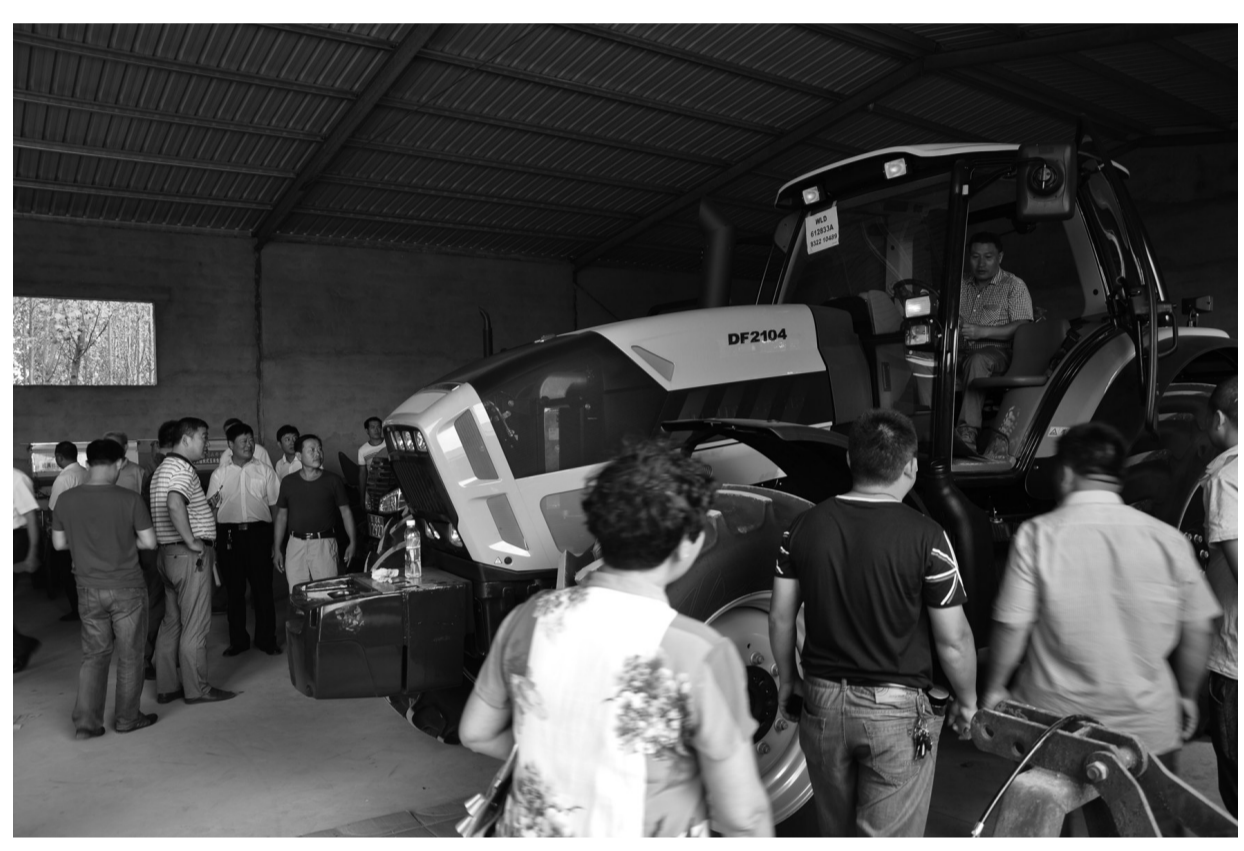
□通讯员 宋成友 孙璐 为充分发挥农业机械化在“三秋”农业生产中的主力军作用, 西王庄镇早计划、早动员、早准备、早部署、早安排, 全力以赴做好“三秋”农机化作业各项准备工作。图为该镇付刘村合作社通过农机直补购买的价值81万元的道依茨-法尔DF2104轮式拖拉机, 该农机是集深松、深耕、联合耕地、灭茬于一体的全自动无人车, 为全市首家。

□通讯员 徐倩 孟庄讯 “我终于有新工作了!”社区矫正人员王某兴奋地说, “我一定努力工作, 积极改造!”近日, 孟庄司法所组织十余名社区矫正人员到市人力资源市场参加人才招聘会, 为其找工作创造有利条件。没有正当职业, 社区矫正人员很难维持正常生计, 极易重新犯罪。通过每月的教育谈话, 孟庄司法所筛选出十余名未就业和有更工作意向的社区矫正人员, 详细了解其技术、特长、工作经历、有无创业意向等情况, 组织他们到市人力资源市场, 积极帮助他们与用工单位进行洽谈。同时, 指导有创业意向的社区矫正人员填写创业指导申请表, 以便获得正规、专业的创业指导。