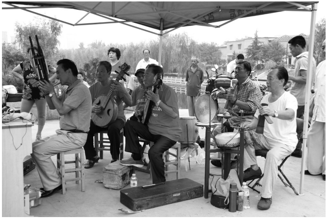
北龙头社区柳琴豫剧庄户剧团揭牌暨计生进社区活动