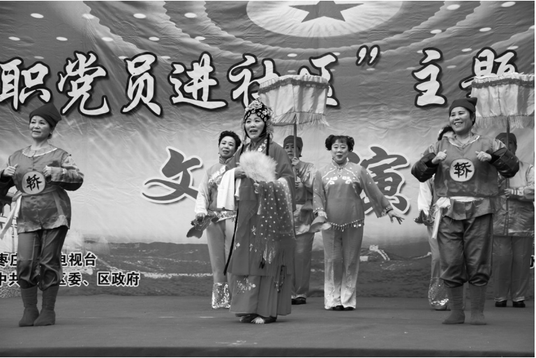
传统庄户剧来到群众身边

今年以来，文化路街道以创建文化强省先进区为总抓手，以提高市民综合素质、丰富城市文化内涵、树立良好社会风气、提升城市文明形象为目标，通过加大投入力度、整合辖区资源，大胆创新，初步形成了“政府统筹、地区协调、社会参与、资源共享、功能多样、服务群众”的基层文化服务工作格局，群众文化活动精彩纷呈，公共文化事业建设繁花似锦，老百姓的精神家园正建设的越来越美丽。