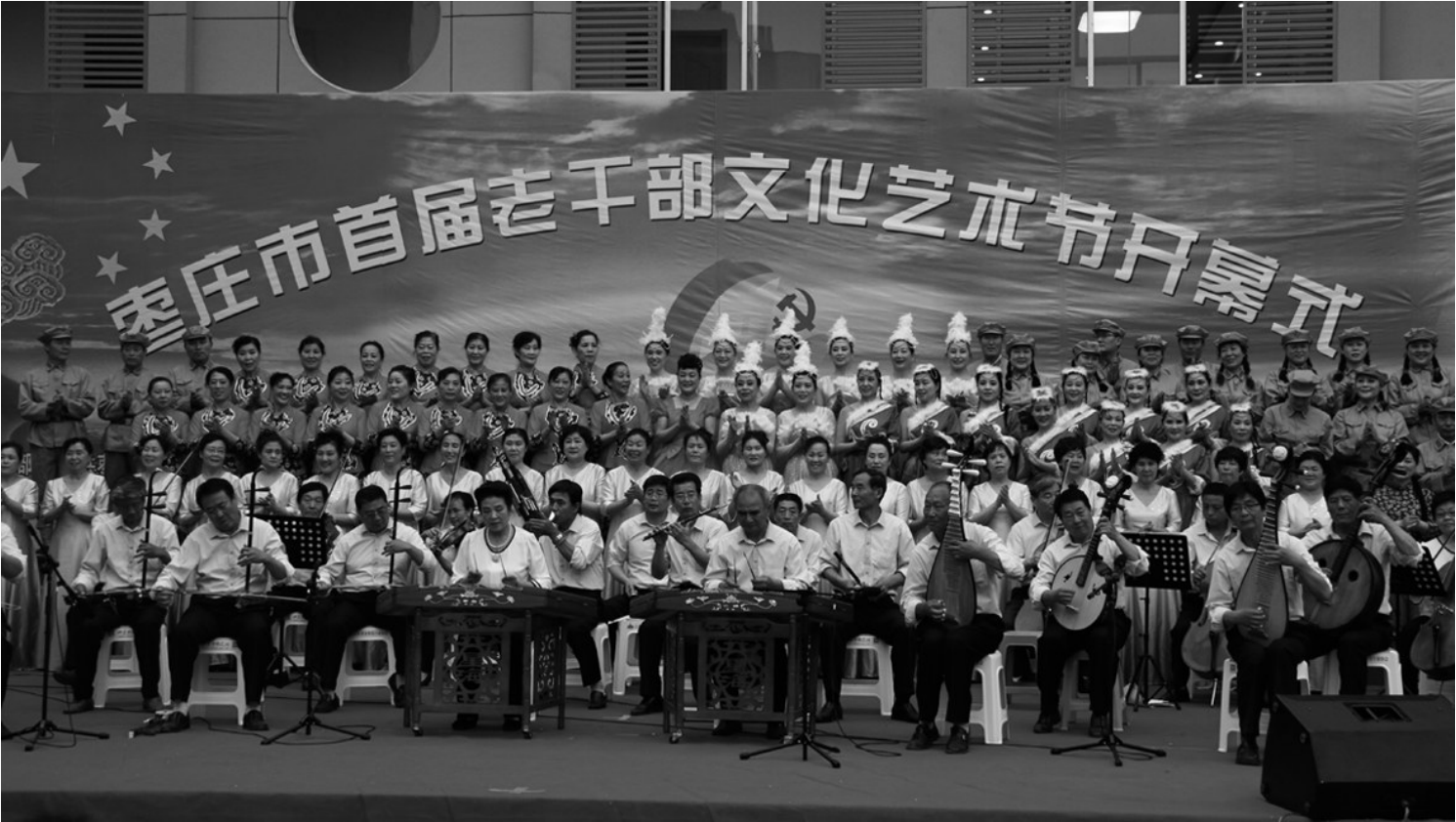
枣庄市首届老干部文化艺术节开幕式在立新社区文化中心举办