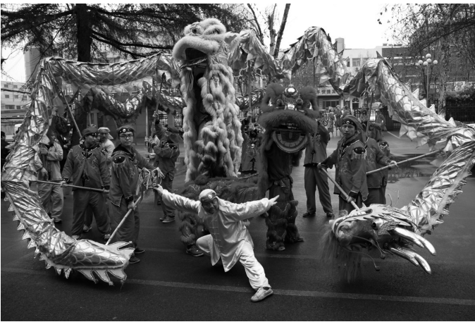
传统北斗庙会上的舞龙舞狮表演

推动发展文化经济。用足用好各级扶持政策，大力发展音像、图书、印刷、文化用品制造业，扶持企业品牌建设，成为行业龙头企业。重点扶持清和文化产业有限公司、兴安彩印有限公司等文化产业项目，争取上规模、出效益，打造新兴文化产业的创领者。同时大力发展群众性公益文化事业，做大做强文化品牌，不断完善街居文化基础设施，以此来带动文化服务相关产业发展。