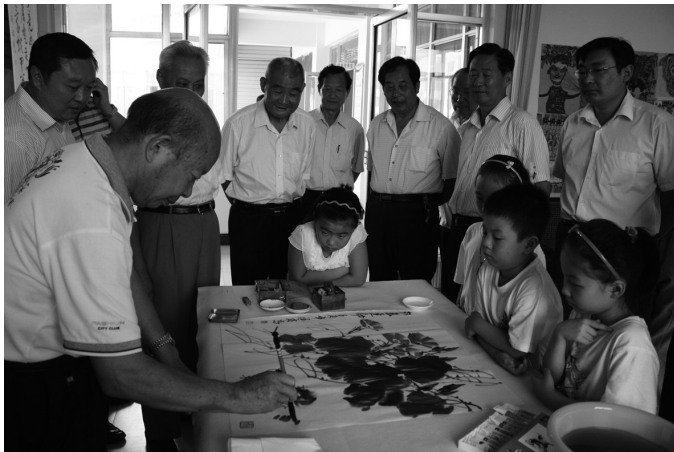
老年诗画协会会员指导孩子们书画技巧