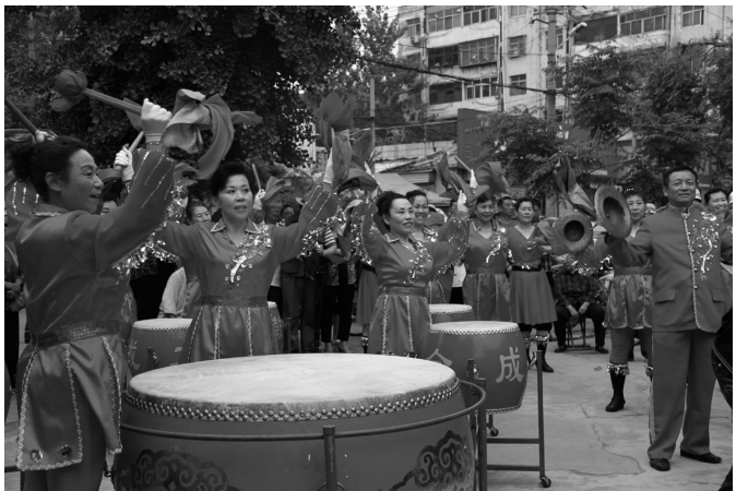
喜庆的锣鼓敲起来