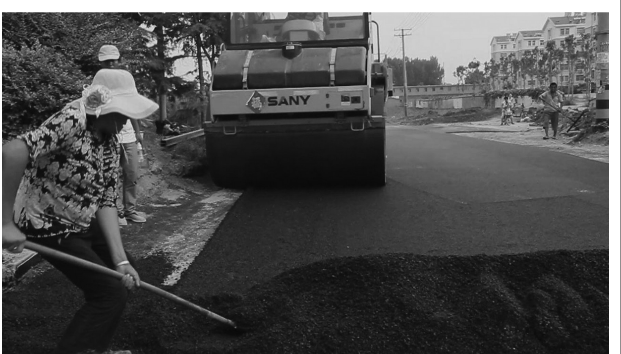
□通讯员 邱枣庄 王昆 近日,永安镇寨子村村两委委员温建在华化矿业集团、丰源建设置业有限公司以及政通路桥有限公司的大力协助下,又自掏腰包40万元,对小屯村东面的谷山路进行了重修。一条长约800米的柏油路解决了群众行路难的问题,也方便了前来区人力资源与社会保障局服务大厅办事的群众。

该街道全面开展消防安全网格化监管工作。建立起以社区、网格为基本单元的安全生产责任区,落实人员,明确责任。确定负责各社区安全生产工作的责任人、挂点街道领导、安全生产巡视员,明确工作人员在责任区内的安全管理职责。