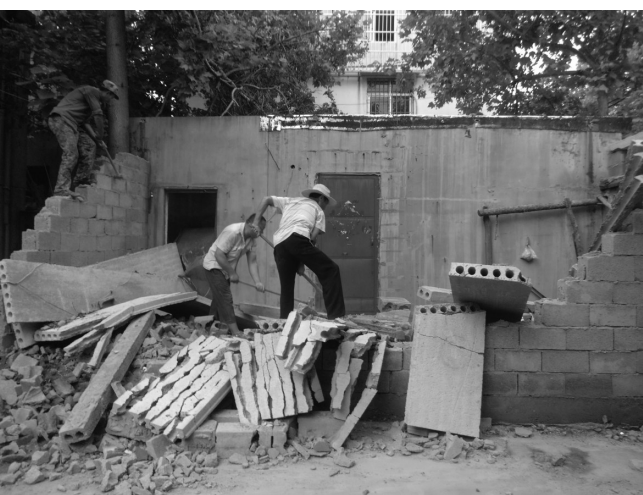
□通讯员 杨孝 7月18日,文化路街道行政执法中队依法拆除新声路地震局宿舍院内1处违章建筑,还居民一个宽松的生活环境。

该街道通过多种形式宣传《兵役法》等政策法规,在辖区路口醒目位置悬挂征兵宣传标语,提高群众对征兵工作的知晓率。同时,在辖区人员密集或人口流动量大的地方分发征兵宣传资料,号召适龄青年踊跃参军。他们还开展入户宣传活动,将今年征兵条件、征兵政策等情况宣传到每家每户,充分激发有志青年参军热情。针对部分青年和家长提出的问题,工作人员详细地向他们介绍了适龄青年应征入伍享有优惠政策以及义务兵服役期间的待遇,及时消除他们的后顾之忧。