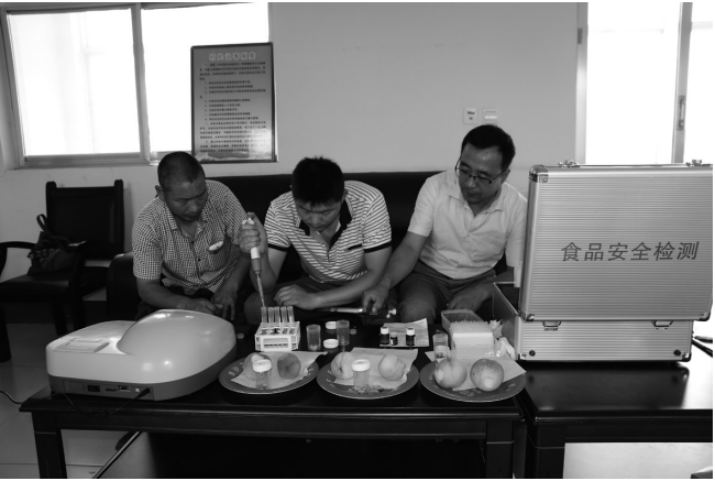
□通讯员 刘勇 王艳龙 连日来,孟庄镇组织农业、农技等部门人员对辖区内即将上市的水蜜桃进行农药残留检测,保证了无公害水蜜桃上市销售。

□通讯员 李晓娣 张超 塔塔埠讯 为进一步提高人民调解员的政策理论、业务水平,近日,塔塔埠司法所举办了调解主任培训班,该街道9个社区调解主任参加了此次培训。此次培训以“全面依法治国与司法行政”为题,结合基层司法行政工作全面讲解了依法治国思想的历史趋势及重要意义。同时以案说法指出人民调解员的重要职责及当前社会做好人民调解工作的重要性,鼓励广大调解员要满腔热情为人民服务,充分发挥法律明白人的作用。