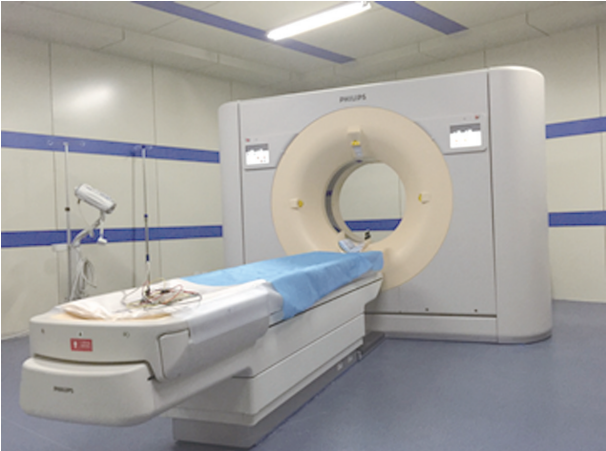
飞利浦微平板 30 iCT(256层极速螺旋CT)

中心与北京、上海、济南等国内多家乳腺、甲状腺疾病治疗的知名机构建立良好合作关系,将经常性邀请相关知名专家教授前来讲学、坐诊,积极开展学术交流活活动,不断促进中心快速发展。在各级领导的重视和支持下,枣庄市立医院乳腺甲状腺诊疗中心将不断提高诊疗技术和服务水平,大力开拓医疗市场,必将成为覆盖鲁南地区以至全省的先进治疗中心。