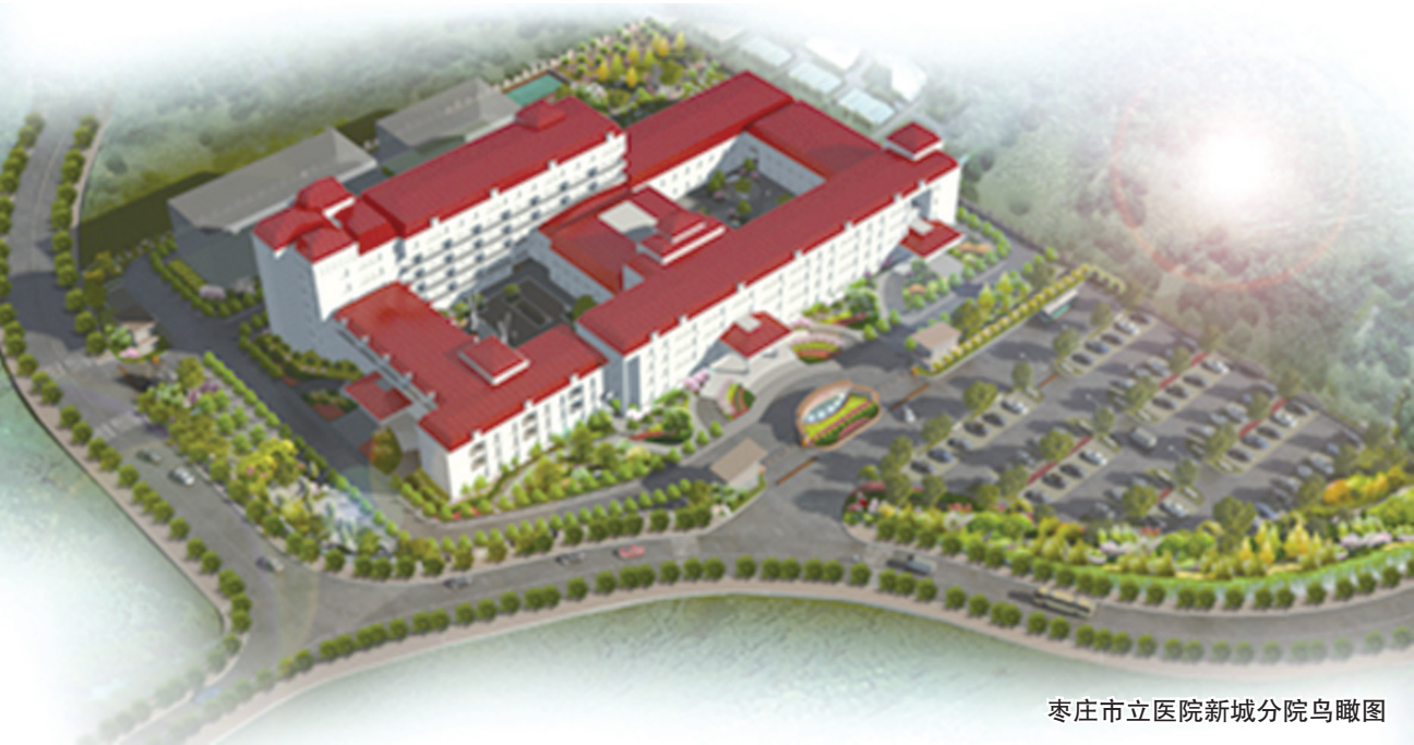
枣庄市立医院新城分院鸟瞰图