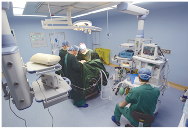
新城分院百级层流净化手术室