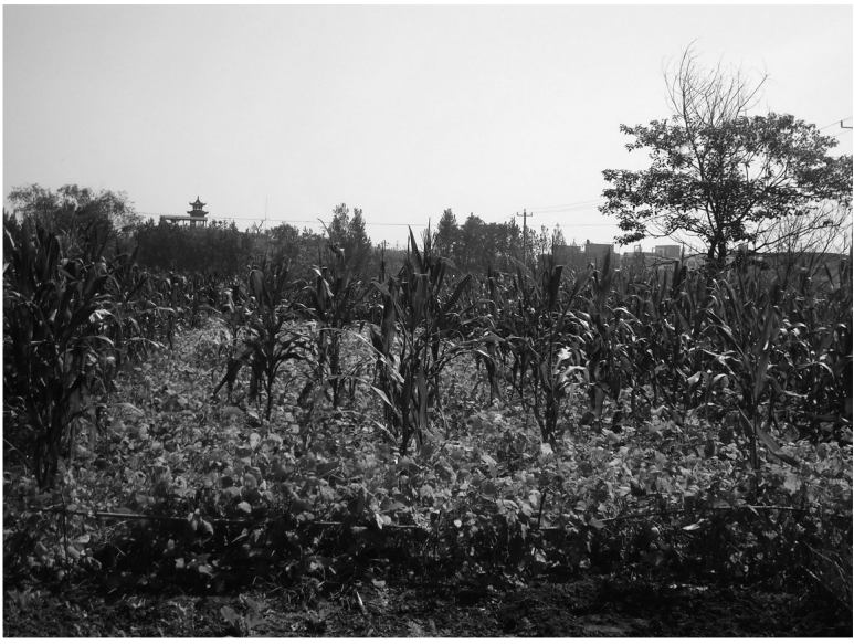
青纱帐里埋忠骨，鹿广连烈士墓地所在地