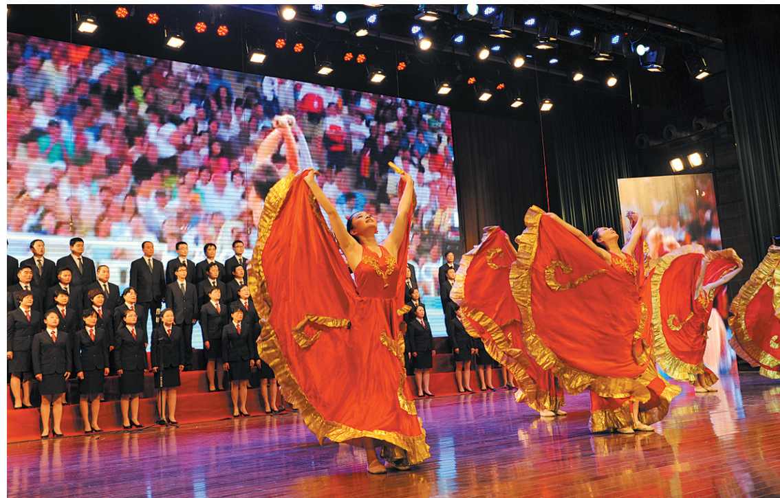
组织丰富多彩的职工文体活动,弘扬社会主义核心价值观