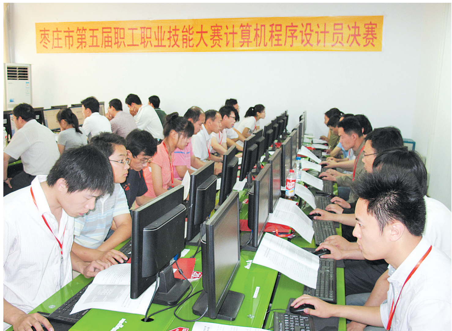
围绕全市工作大局,开展争先创优活动,举办六届全市职工职业技能大赛,加快高技能人才队伍建设