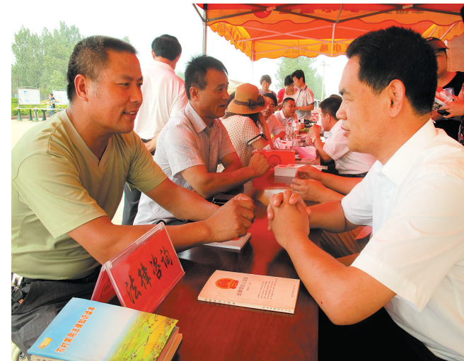
建立工会法律维权平台,开展工会法律援助活动