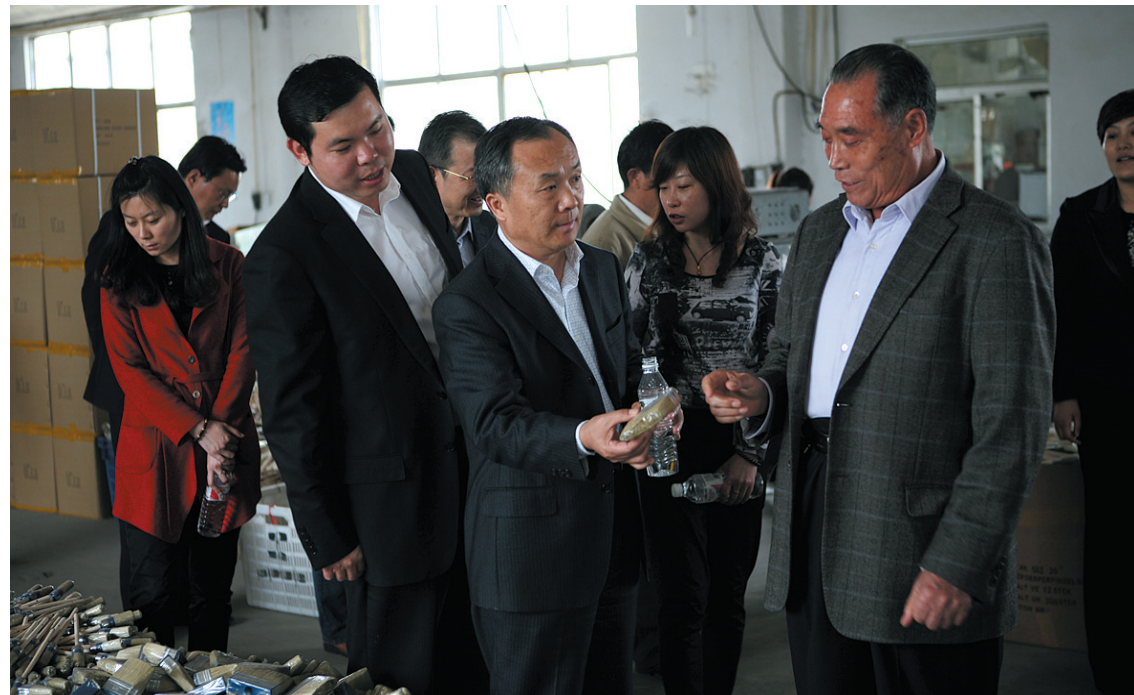
加强作风建设,服务职工群众