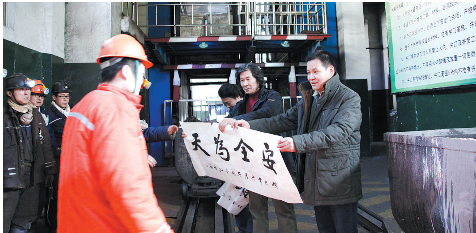
发挥工会大学校作用,举办“送文化下企业”活动,增强职工安全意识