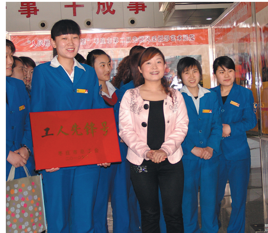
广泛开展“工人先锋号”创建活动,覆盖各行各业