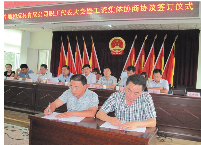
构建和谐劳动关系,广泛开展工资集体协商工作,维护职工合法权益