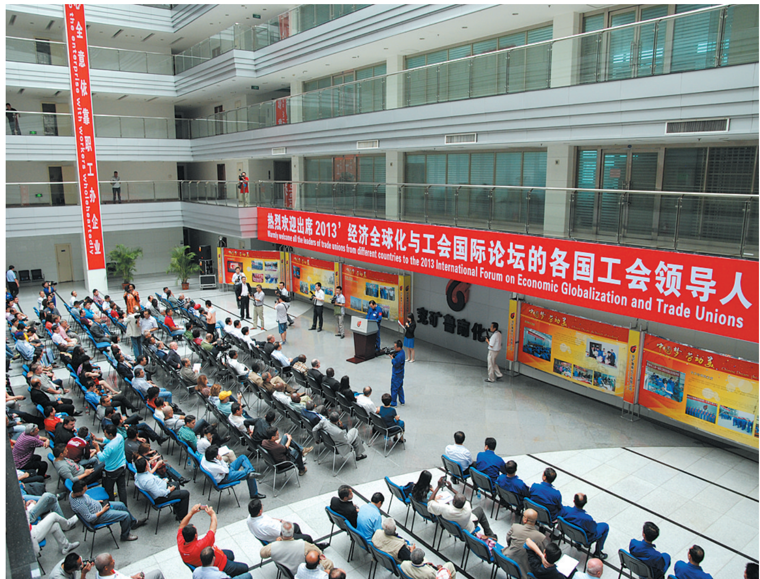
成功承办2013'经济全球化与工会国际论坛等重要活动,展示了我市转型发展的成果,扩大工会对外交流