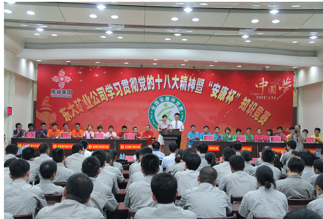
加强群众性安全生产工作,持续开展“安康杯”竞赛活动