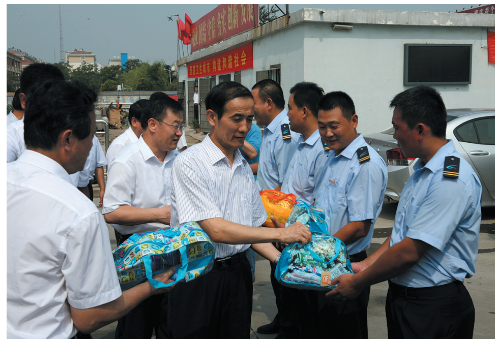
市总工会连续18年坚持开展“四季服务”活动,图为市委常委、宣传部长张宝民为一线职工“送清凉”

枣庄市工会第十二次代表大会以来,全市各级工会组织和广大工会干部,在市委和省总工会的坚强领导下,认真履职,依法维权,在服务大局中显身手,在服务职工中展作为,在服务基层中谋创新,团结带领广大职工群众以主人翁姿态积极投身改革建设的伟大实践,为全市经济跨越发展、社会和谐进步作出了积极贡献,谱写了枣庄工运发展史上的绚丽篇章。