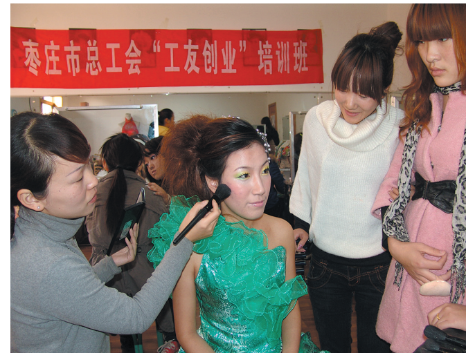
深化工友创业行动,为下岗职工开展就业服务