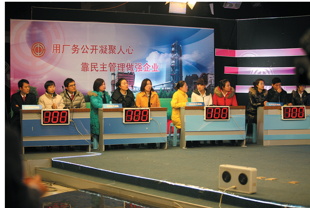
积极推进厂务公开工作,落实职工民主权利