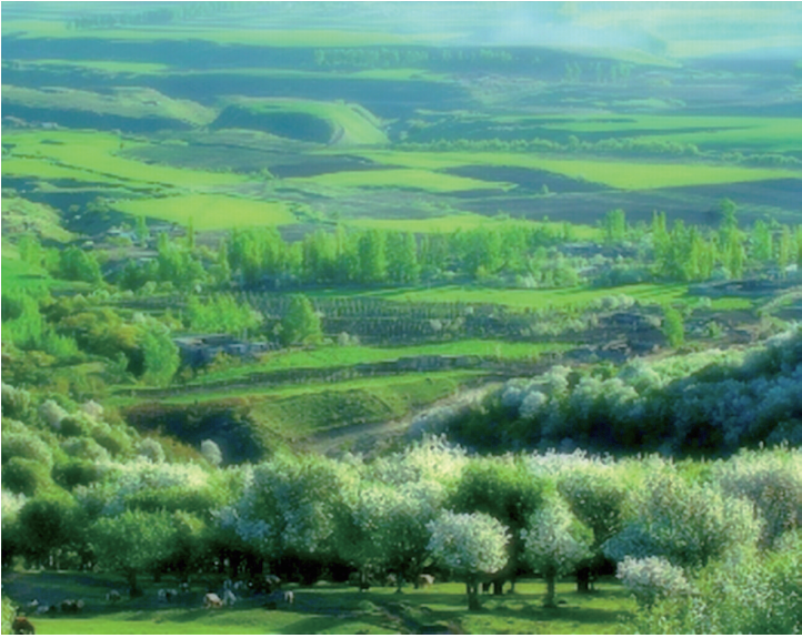
《丽影花飘香》