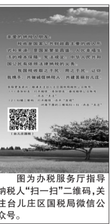
图为办税服务厅指导纳税人“扫一扫”二维码,关注台儿庄区国税局微信公众号。

800份,实现了一次补录,长期受益。三是办税全天候。大力推广电子办税,优化网上办税,完善移动办税,拓展税企互动、预约服务、业务受理、网上交税等功能,纳税人可以随时随地办理涉税业务,实现“掌上办税一点通”,做到了“如影随形”。(台儿庄区国税局 王开瑞)