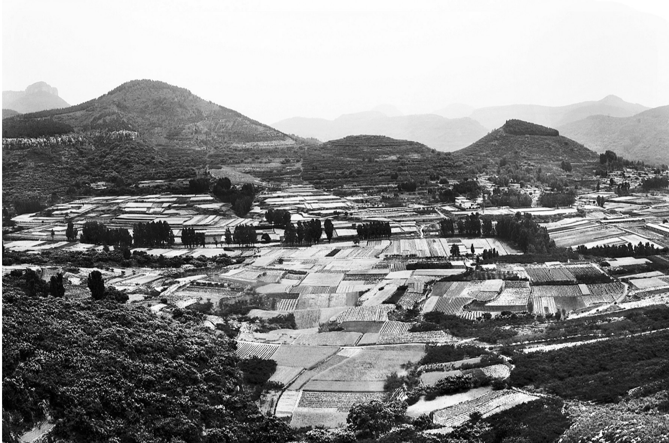
诗意麦田

据此推测,浦东迪士尼乐园未来的旋转木马,又会有何新的创意?或许会加入中国文化元素?命名为《西游记》里唐僧西天取经骑的那匹“白龙马”?或许取名“千里马”?诸如此类的文化符号,说不定会被迪士尼公司的“梦幻大师”所采纳。