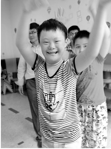
不一样的「苹果」,同样拥有灿烂的笑容。

流,为她建立了评估档案,提出具体的个训方案。经过一段时间的一对一个训,目前孩子已能进行简单的语言交流,会走平衡木,一条腿已学会单脚跳。看到孩子的变化,家长激动之情溢于言表:“为了给孩子看病,家里经济早已不堪重负。感激康复中心为孩子进行免费康复。” “智障孩子给其家庭带来了沉重的精神和经济压力,而特殊教育就是为这些家庭创造希望,让心智残障的孩子能自尊、自信、自强、自立地生活。”校长侯霞满怀信心地说。 这是一群可能终其一生都无法长大的孩子,他们的生活或许沉重而艰难。但是,如果我们所有的人都能多一些鼓励的话语,肯定的眼神,他们也许就会发光。他们只是那只特殊的“小苹果”——虽然和大多数孩子不一样,但同样纯净美好,他们更需要得到您的关爱与呵护。