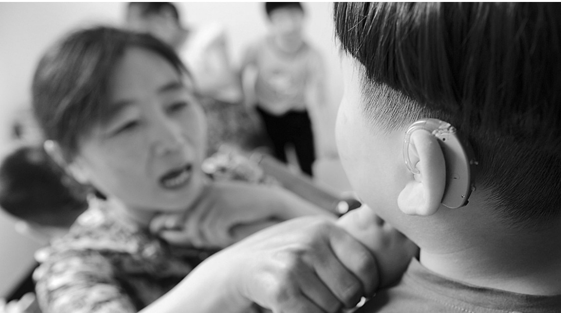
上千次的触摸只为换来无声世界爱的“声音”。