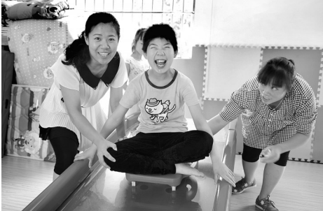
无微不至的呵护和关怀

孩子问妈妈:“为什么我和别的孩子不一样?” 妈妈回答他:“在上帝看来,每个孩子都是一只苹果,因为你是最香甜的,所以上帝忍不住多亲了你一口。” 孩子,是这个世界上最美好的存在,他们带来了源源不断的生机和希望。可在这缤纷的世界里却还有着这样一群孩子,他们眼神黯淡、行为笨拙,别人听不懂他们咿呀的语言,看不懂他们比划的手势,他们从出生的那天起智力就存在缺陷,但是他们有着和正常孩子一样清澈的笑容和纯净的心,他们需要大人的守护,他们是不一样的“小苹果”。 日前,记者走进薛城区残疾人综合服务中心,用镜头记录下守护在这些智障儿童身边的美丽天使和在这里快乐成长的“小苹果”。