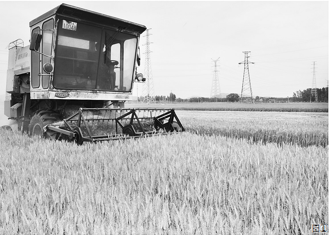
连日来,我区采取有力措施,全面开展三夏生产,确保颗粒归仓。图①为联合收割机正在西王庄镇后古屯村田间抢收。图②、图③为孟庄镇刘岭村村民喜获丰收。

□通讯员 吴琛 陈砚平 为加强辖区养老机构安全管理工作,防止和杜绝各类安全事故发生,近日,文化路街道食药所联合安监办,对南龙头老年公寓和祥福老年公寓两所私营性质的养老院开展了安全检查。