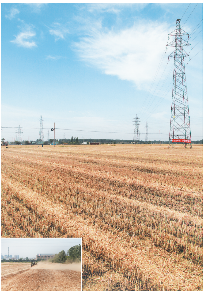
近日,记者在齐村镇郭村的麦田看到,在联合收割机械的帮助下,这个村的小麦收割进展顺利。据悉,我区小麦收割工作已经全面展开,预计6月中旬将完成全部收割任务。