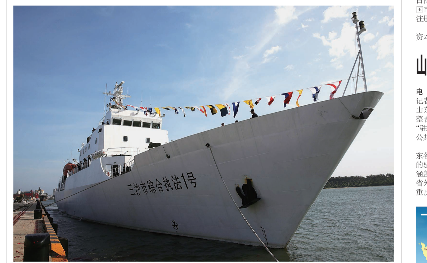
海南三沙市综合执法1号船交付使用。停靠在海南文昌清澜港的三沙市综合执法1号船(5月20日摄)。当日,海南省三沙市综合执法1号船正式交付使用。该船长97.5米,宽14米,排水量2600吨,设计航速22节,是目前三沙市吨位最大、性能最先进的执法船。三沙市综合执法1号船近期将在三沙海域开展巡航。

行为,不会因为敌对势力的批评就选择放弃。声明指出,当今美国等持续对朝进行“威胁恐吓”,企图侵略朝鲜,颠覆朝鲜政权。朝鲜将以强大的地面、空中、水上战略打击手段为支柱,进一步迅速强化自卫性核遏制力。这是朝鲜军民坚定不移的意志和一贯立场。