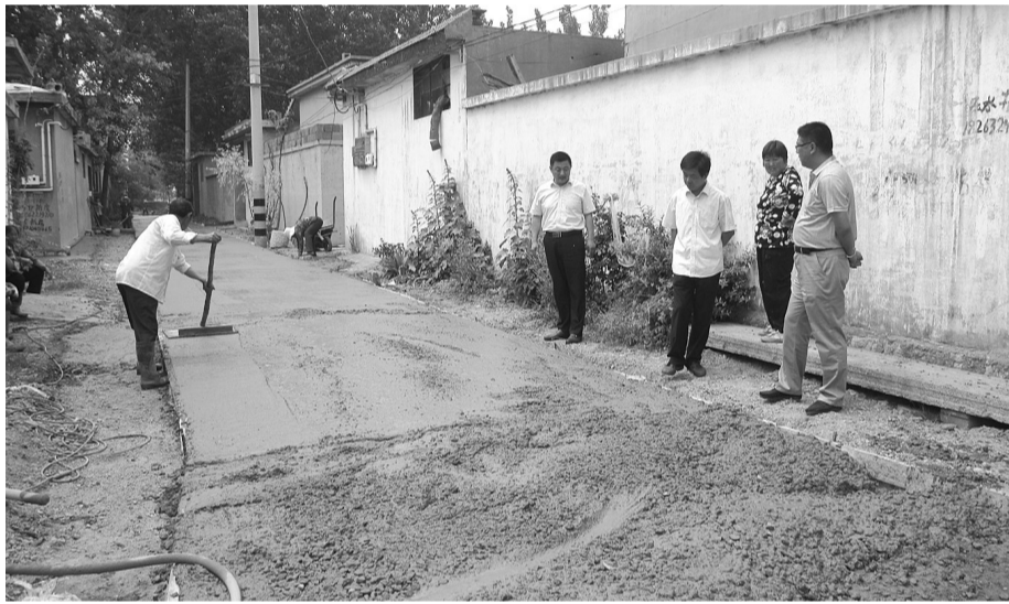
近日,薛城区陶庄镇孔庄村主干道硬化工程正在有条不紊进行。该村是今年薛城区交通运输局帮扶村,“第一书记”进驻该村后,将硬化村道路作为帮扶的第一件实事,与镇、村共同筹措近40万元资金,对村内16条全长3.6公里的道路进行硬化改造,方便群众的生产生活。

四是完善管护台账,实现动态监管信息化。以测量标志动态监管信息化建设和标志普查为契机,及时修正、更新了标志管护资料,建立了信息化电子版和纸质两套标志管护台账,完善了标志点之记、委托保管书,制作了普查维护前后的标志实景图资料,完成了动态监管信息化系统的资料输入工作,实现省、市、县三级测量标志信息化管理的互联互通。(高训蒙 李茂珍)