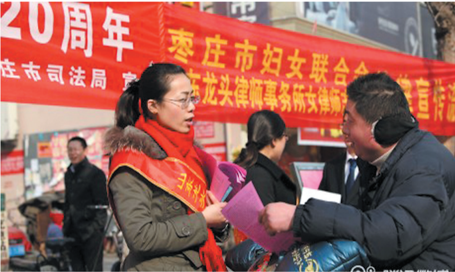
为纪念“三八”妇女节及男女平等基本国策实施20周年,枣庄市司法局联合相关单位组织法律工作者开展专题法制宣传活动,大力宣传男女平等基本国策、妇女权益保障相关法律等,进一步提高男女平等基本国策的社会知晓率和认同度,提升广大妇女维权意识。

做好新形势下司法行政工作责任重大,使命光荣。全市司法行政系统广大干警要在市委、市政府的坚强领导下,振奋精神,再接再厉,求真务实,扎实工作,为全市经济社会转型发展做出新的更大贡献!