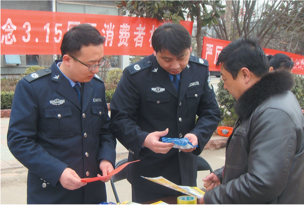
为纪念“3.15”国际消费者权益日,枣庄市司法局开展“携手共治,畅享消费”主题法制宣传活动,组织律师、公证员、基层法律服务工作者走上街头,向广大消费者宣传相关法律法规,解答消费者提出的各种法律咨询。图为滕州市司法局东郭司法所干警向群众宣传法律。

2014年,全市司法行政系统涌现出了一大批受到市级以上表彰的先进集体和先进个人。现选一部分先进代表表彰如下,望系统内