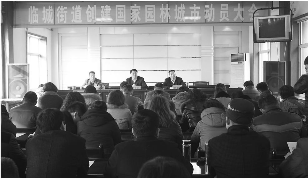
↑2月3日,薛城区临城街道召开创建国家园林城市动员大会,街道全体科级干部、村居全体人员、机关部门及双管单位负责同志共计100余人参加会议。明确了工作责任和目标任务,街道上下迅速掀起创建国家园林城市热潮。