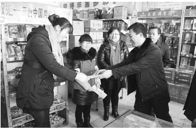
←春节临近,峰城区坛山街道总工会深入到枣庄润东针织服饰有限公司、大运酒水有限公司等企业,对26名困难职工进行走访慰问,发放慰问金13000元。让他们感受到党和政府的关怀和温暖。