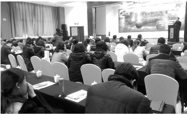
←2月3日,浙江安吉旅游推介会走进枣庄,来自全市八十多个旅行社的三百多名旅行社业界人士分享了中国竹海、魅力安吉的秀美风光。