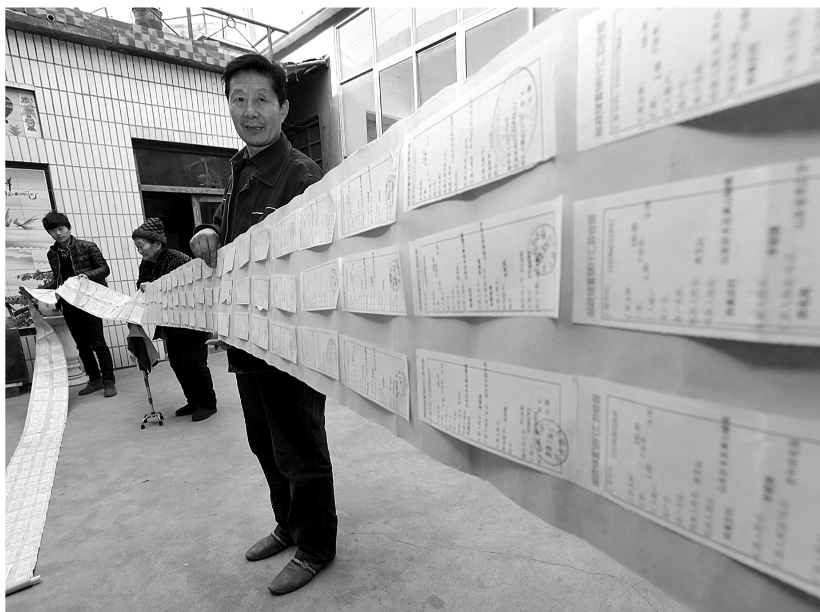
▲12米长的特殊“汇款单”。