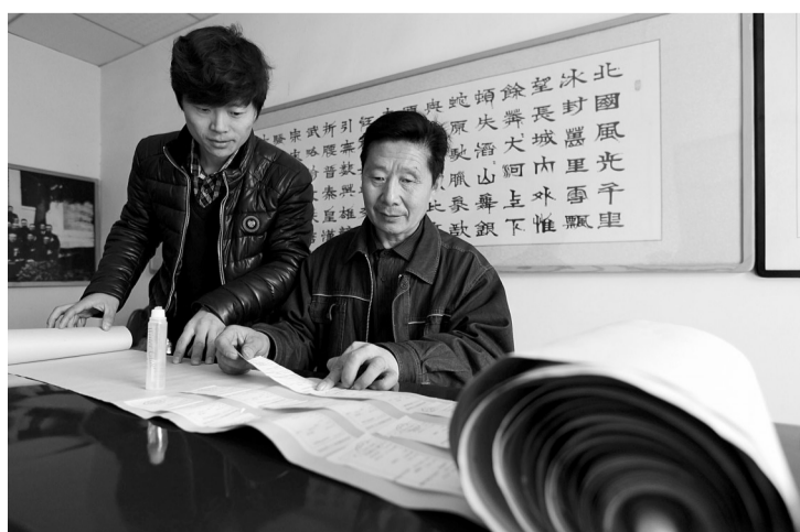
▲和儿子一起整理特殊“汇款单”。