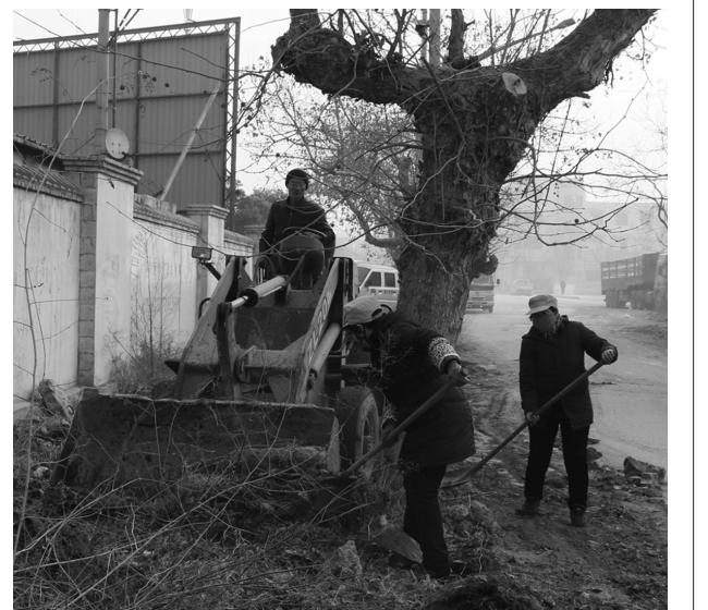
□通讯员 魏敏 宋平 1月10日,龙山路街道辛庄社区组织环卫工人10余人,出动铲车2辆(台),垃圾运输车1辆(台),对广济西路进行了全方位的清理,共清理杂草、建筑垃圾等30余车。

□通讯员 贾广涛 中心街讯 为进一步改善人居环境,提升群众满意度,近日,中心街街道组织机关全体人员在开元花园开展了卫生大清理活动,该街道广泛动员,全面参与。开元花园由于建成时间较早,一直没有物业管理,存在废物丢弃的现象,该街道组织全体机关人员对小区进行了卫生大清理。据了解,开展此次卫生大清除活动,旨在用实际行动带动居民自觉维护辖区环境。此次整治活动,共清运垃圾6车,清扫道路800多米。