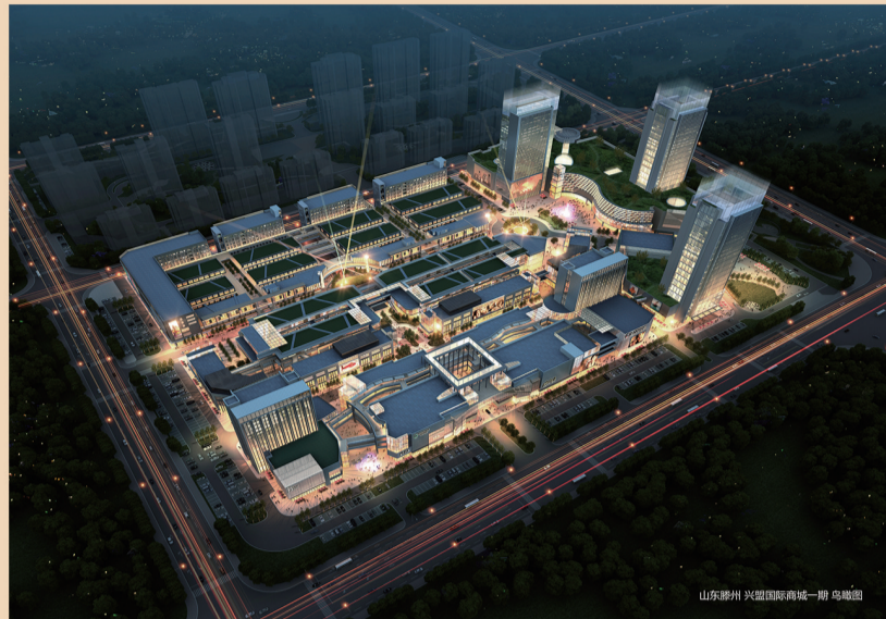
即将竣工的兴盟国际商城一期五金机电建材区

得热火朝天的建筑工地对笔者说: “我在兴盟国际商城买了两间商铺, 明年5月份就可以营业, 你看门窗玻璃幕墙都已经装上了, 档次提高了一大截, 我也有了真正属于自己的‘门面房’”。