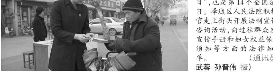
12月4日是首个“国家宪法日”,也是第14个全国法制宣传日。峄城区人民法院积极组织开展法官走上街头开展法制宣传和法律咨询活动,向过往群众发放宪法宣传手册和妇女权益保障、诉讼须知等方面的法律知识宣传单。