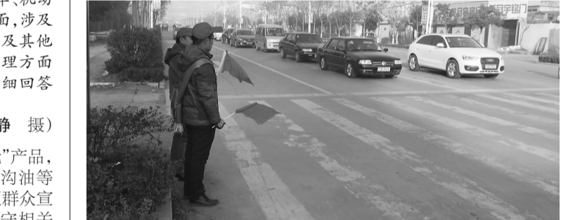
12月6日,峰城城管局安排执法管理人员,在学校门口参加文明交通护花行动,推进文明城市创建工作。