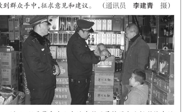
近日,阴平警务室配合派出所开展辖区九小场所检查活动,检查消防设施的配备、安全出口及疏散通道畅通等,并培训业主灭火器的使用方法。此次活动,查出隐患4处,责令现场整改2处,限期整改2处。