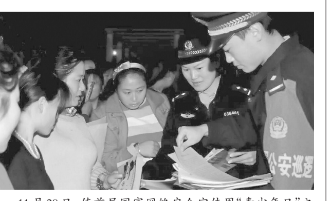
11月29日,值首届国家网络安全宣传周“青少年日”之际,峄城公安分局网安大队民警深入中小学开展网络安全教育。网安民警通过放映公益短片、知识问答、案例讲解等方式进行网络安全教育。