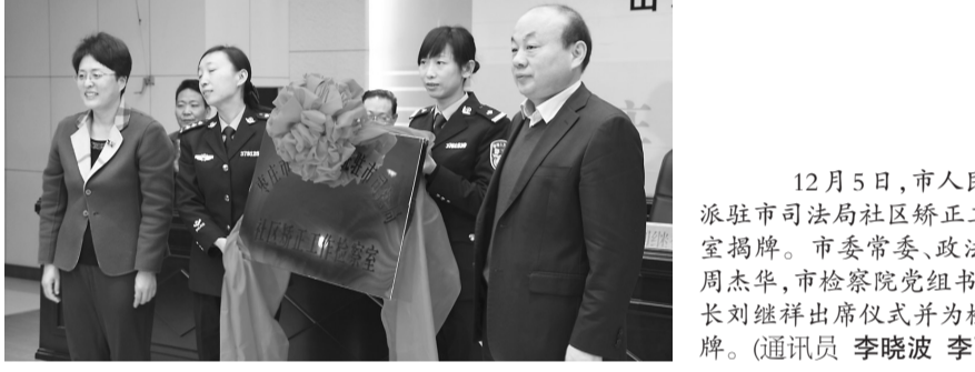
12月5日,市人民检察院派驻市司法局社区矫正工作检察室揭牌。市委常委、政法委书记周杰华,市检察院党组书记、检察长刘继祥出席仪式并为检察室揭牌。