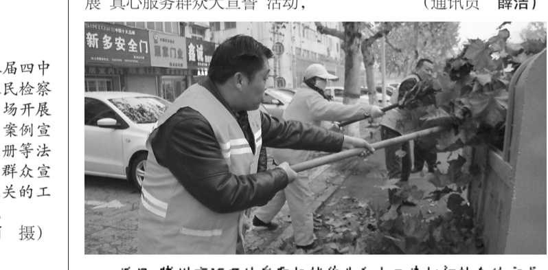
近日,滕州市环卫处采取机械作业和人工清扫相结合的方式,对道路树叶进行清扫。

诚心听民声。薛城城管局多次召开座谈会,邀请市民代表、经营业主、流动商贩等共同探讨城市管理中的重点难点问题。开展大走访活动,询问群众对城市管理的建议,现已征求意见30余条,解答疑问100余条。细心挖根源。针对座谈会和走访中遇到的问题,薛城城管局开展“真心服务群众大宣誓”活动,