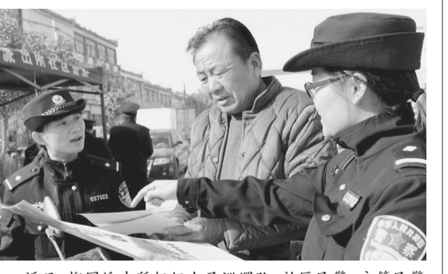
近日,榴园派出所组织女子巡逻队、社区民警、户籍民警深入集市,向群众宣传安全防范及法律常识,为群众答疑解惑、办理户口问题,把公安宣传挂历、《治安防范宣传手册》发放到群众手中,征求意见和建议。

民警坚持走访村居,对重点村居重点走访,对不稳定因素进行全面细致排查。同时对失业返乡农民工、征地拆迁等方面重点排查,坚持走访责任人、稳控重点人。对辖区6名