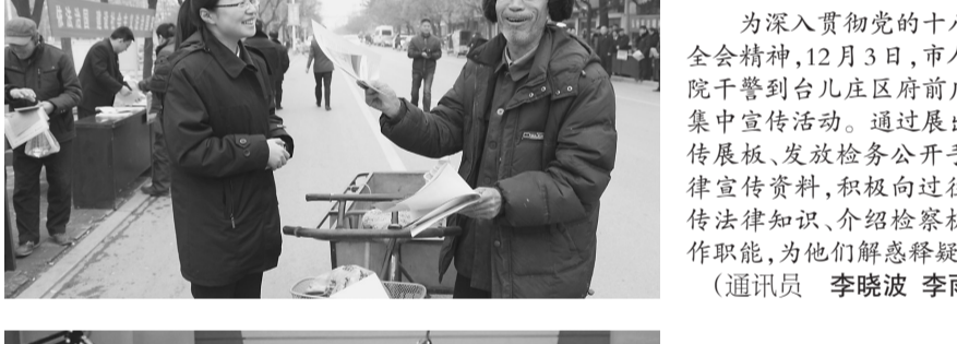
为深入贯彻党的十八届四中全会精神,12月3日,市人民检察院干警到台儿庄区府前广场开展集中宣传活动。通过展出案例宣传展板、发放检务公开手册等法律宣传资料,积极向过往群众宣传法律知识和介绍检察机关的工作职能,为他们解惑释疑。