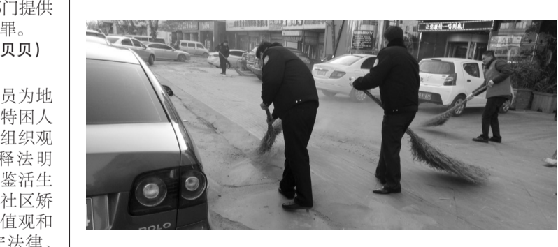
薛城城管一直认真开展“双包双联”活动。图为12月5日城管队员在马路边打扫卫生。