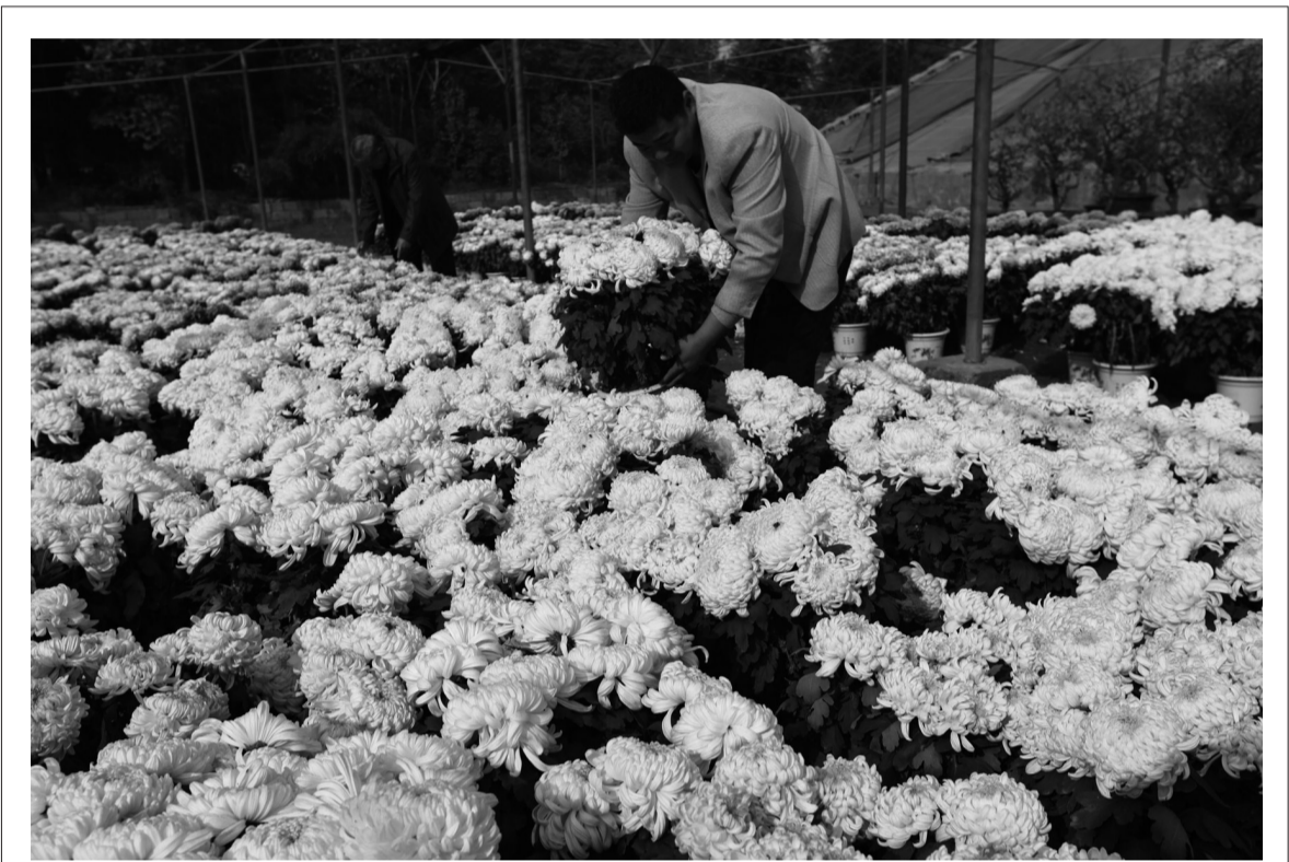
□通讯员 吉喆 耿德刚 初冬时节，许多花农抢抓“花时”，对一些花卉及时移入温室大棚，进行冬季管理阶段。据悉，我市目前成规模的花卉培育基地有100多家，带动了农民增收致富。图为11月9日，光明路街道西郊花卉培育基地的技术人员在把室外培育的菊花移入温室大棚。