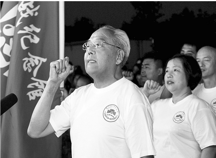
▲宣誓——把抗日英雄事迹传下去。