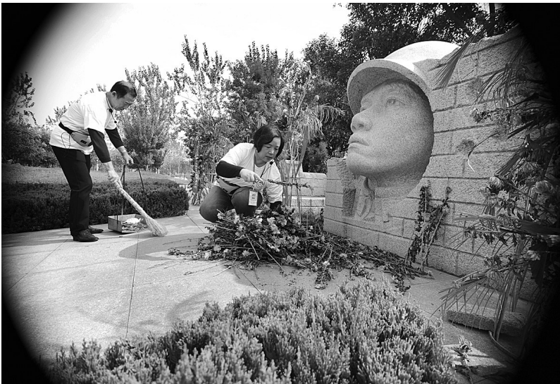
▲清理烈士墓碑前的杂草。