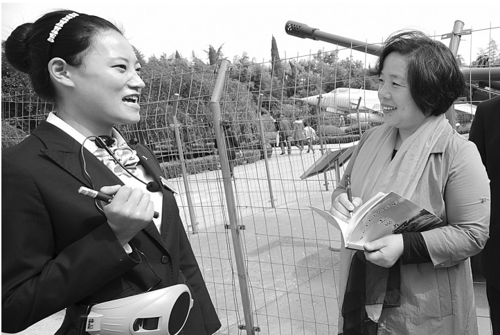
▲虚心向专业讲解员请教。