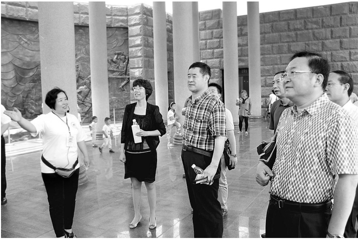
▲市信并茂的讲解得到中央文明办领导的充分肯定。