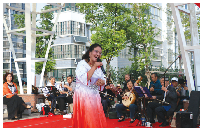
日前,市中区龙山路街道在道南社区举办了送戏进社区文艺演出活动。锦龙剧社的演员们先后演出了《祝福祖国》、《我爱你中国》等15个节目。图为演出现场。