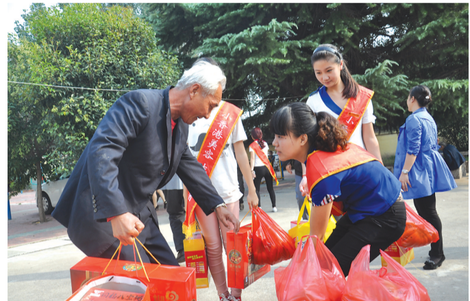
10月3日,薛城区常庄镇宣传办、文明办等联合小香港美容院带着慰问品到该镇幸福院看望老人,为老人们送去了香肠、八宝粥、水果等礼物,并陪老人们唠家常,祝福老人们晚年幸福。

相关手续由竞拍人自行办理。个人竞拍购买车辆后,车辆使用产生的一切责任由竞拍人自负,街道和社居不承担任何责任。为进一步加强公车改革工作的领导,街道成立社居公车改革领导小组,负责具体工作的实施与督导。目前,街道居级公车全部参与了改革,并实行了公开竞拍,现在正办理车辆过户、入账等相关手续。(李治民 李佳法 赵正龙)