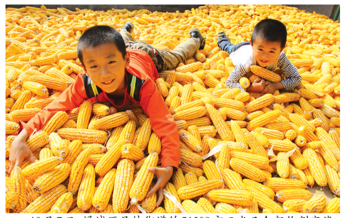
10月7日,峰城区吴林街道的51300亩玉米已全部收割完毕。据悉,今年玉米每亩产量约1050斤,比去年每亩增产200多斤,农民尽享丰收喜悦。

今年以来,该镇非公企业党群综合服务中心共开展学习培训、人才交流等活动20余次,参与党员、职工、群众1427人次;组织开展各项文体活动23次,参加人数850余人次。累计向企业提供其他服务70多次。“服务中心为党员职工提供了一个多方面的活动平台,解决了‘活动没场地,服务跟不上’的难题,开展的和服务多了,职工的归属感也强了,公司发展也更具有活力了。”山东耀国光热科技有限公司党支部书记王加柱如是说。(董敏 盛伟)