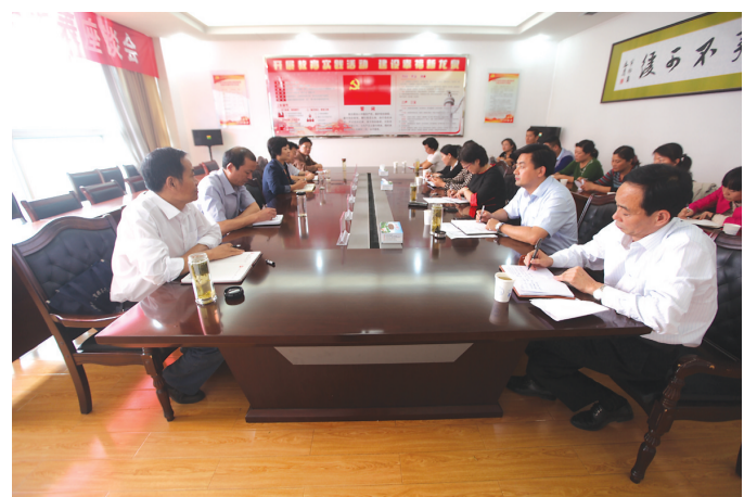
滕州市龙泉街道人大工作室心系民生事业,积极改善居民生产生活。日前,组织辖区人大代表通过座谈,献计献策,集思广益,针对城区集体供热点向滕州市人大提出建议和意见,努力提升群众满意度。

主编:石劲松 篆刻:田始涛 组版:张艳丽 枣庄日报区域部 主办 邮箱:zrzrqysd@163.com