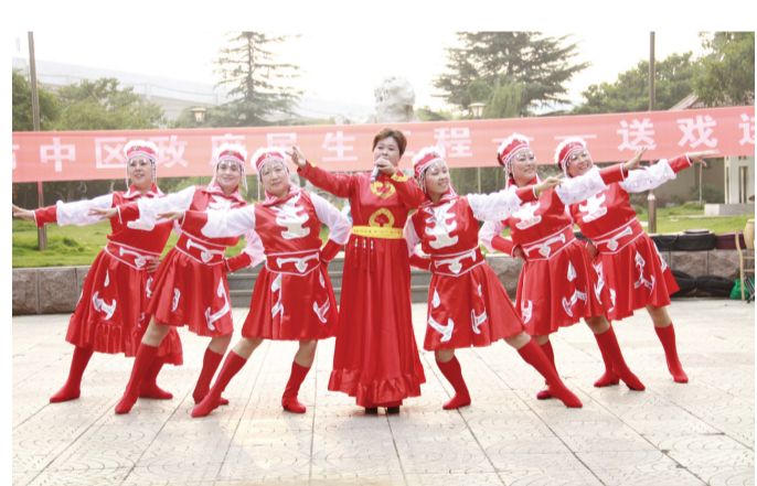
为丰富社区居民的文化生活,日前,市中区民生工程——送戏进社区将“文艺大篷车”开进了文化路街道龙头社区中兴花园小区,为那里的居民们献上了一个精彩的节目,受到了居民的热烈欢迎。