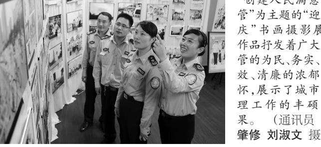
城市管理和谐枣庄