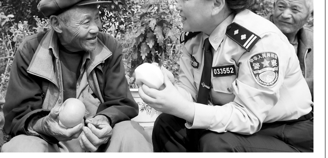
10月2日,市中公安分局永安派出所民警带着慰问品来到社会福利院,陪老人唠家常。