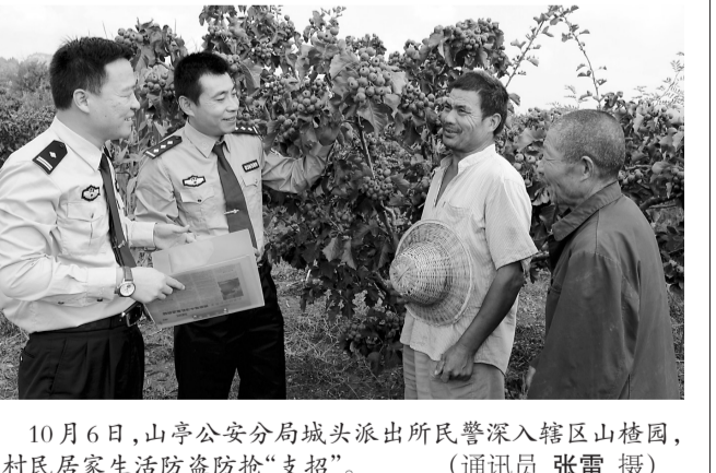
10月6日,山亭公安分局城头派出所民警深入辖区山楂园,为村民居家生活防盗防抢“支招”。

峰城讯 为积极构建和谐警民关系,近日,古邵派出所深入走访社区,了解群众的实际需求和存在的困难,切实把工作做到群众的心坎上。 公开警务,便民利民,提高亲和力。古邵派出所设置警务公开牌、放置群众意见箱、印发《给群众的一封信》、开展“开门评警”、“警民恳谈会”,并自觉接受群众的监督,积极征询群众对派出所公安工作的意见建议。所里定期按照征集的群众意见建议调整工作重心和方向,加强巡逻防控力度。 扶危济困助群众,深化警民鱼水情谊。今年以来,按照年初制定的帮扶计划,派出所领导带领所里的7名正式民警按照“访问民情、访查民意、访排民忧”的原则深入村庄走访,在辖区不同村庄确定了9名高龄、无依无靠的五保户老人为帮扶对象,通过捐款、经常入户帮扶、逢年过节慰问等方式为老人们解决了生活上的困难。 小事不小看,与社区群众建立连心桥。9月2日,民警孙中志在辖区巡逻时,发现大早庄村两户村民正闹得不可开交,询问得知,两家是因为下水道问题闹起了纠纷,孙中志次日立即帮助他们解决下水道问题。派出所坚持“小案不小办、小事不小看”的原则,通过解决社区内的“小案件”、“小纠纷”、“小隐患”使民警与群众的距离近了,为辖区的经济社会和谐发展营造了和谐稳定的社会治安环境。(通讯员 于涛)