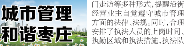
城市管理和谐枣庄

峰城讯 峰城区城管局提前做好预案,在国庆节期间重部署、强落实,强调了道路巡查责任制和文明执法服务