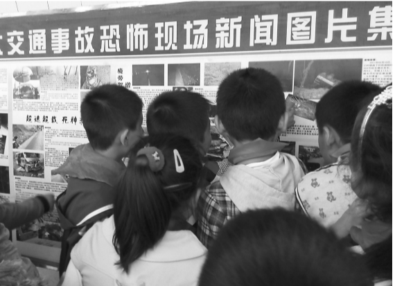
近日,峰城区举行法制展板巡展活动,通过深入全区各镇(街)、村(居)、社区、企业、区直部门、学校,持久、生动的法制宣传,推进法治峰城建设。活动将持续到12月底。图为巡回展走进峰城区阁中心校。

近日,市中区司法局分别在红旗小学、渴口中小学、永安中心小学举办道路交通安全专题报告会,重点阐述作为学校、教师、家长应当如何教育、引导青少年,加强交通安全知识、法律基本常识教育。(陈文)