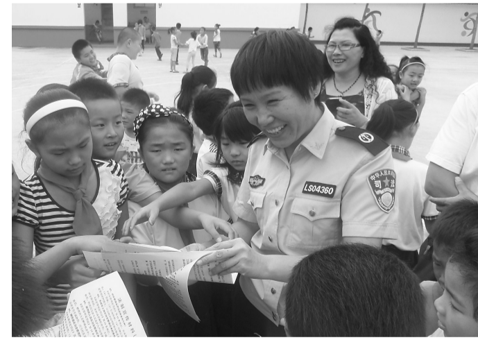
近日,全市各基层司法所纷纷组织干警通过多种形式上好开学第一课。图为滕州市司法局龙泉司法所干警在辖区董村小学开展普法宣传活动。

截至目前,全市已组织法律进校园活动50余场次,举办校园法制报告会、模拟法庭等23场次,受教育师生达4万余人次。(王成 王荣洪)