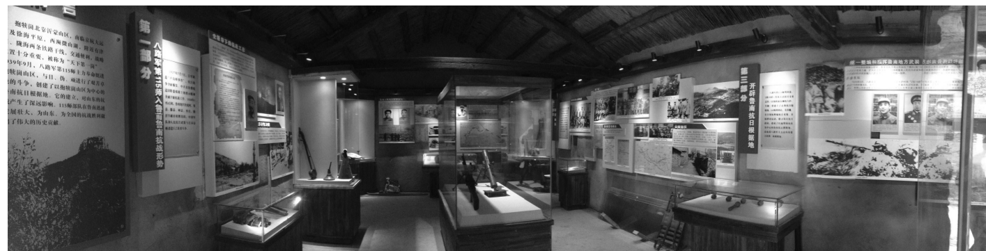
八路军抱犊崮抗日纪念馆展厅