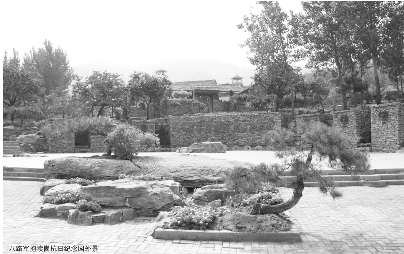
八路军抱犊崮抗日纪念馆外景

抱犊崮背倚沂蒙山区,南临徐海平原,西濒微山湖,附近有津浦、陇海两条铁路干线,战略位置十分重要,被称为“天下第一崮”。1939年9月,八路军第115师主力奉命挺进抱犊崮山区,创建了以抱犊崮山区为中心的鲁南抗日根据地。115师部队在鲁南迅速发展壮大,为山东、为全国的抗战胜利做出了伟大的历史贡献。