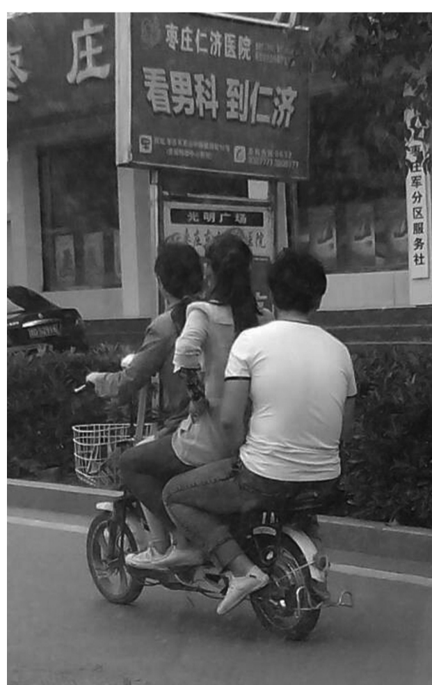
↑时间: 7月29日 地点: 光明路 图片说明: 超员