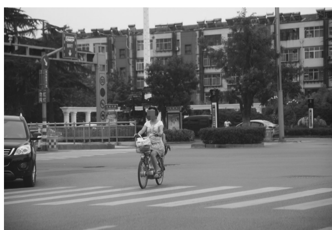
↑时间: 8月6日 地点: 青檀路与光明路交叉口 图片说明: 带着孩子闯红灯