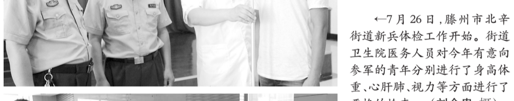
7月26日,滕州市北辛街道新兵体检工作开始。街道卫生院医务人员对今年有意向参军的青年分别进行了身高体重、心肺肺、视力等方面进行了严格的检查。