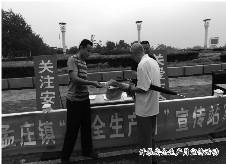
开展安全生产月宣传活动