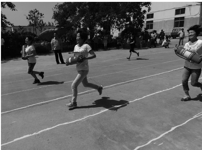
辖区企业开展趣味消防比赛

在今年“三夏”生产中,该镇聘请一批工作责任心强的同志担任村级防火安全员在田间地头,重点地块24小时值守监控;该镇32个村成立了“三夏”防火指挥部,在重点地块设立了防火值勤点,实行24小时轮班制度;通过各个学校把《“三夏”安全防火及禁烧禁抛秸秆保证书》发给每一位学生,让学生带回家让家长亲自签名,以增强广大学生家长家的“三夏”防火意识;同时抽调派出所、行政执法精干力量,配备了8辆防火专用车,实行24小时不间断进行宣传、巡查、督导。该镇科级领导、机关干部到所包的村田间地头实行督导巡查。同时把全镇分为原孟庄和原周村两个片,由分管农业和环境的副镇长全面负责实行24小时巡查。