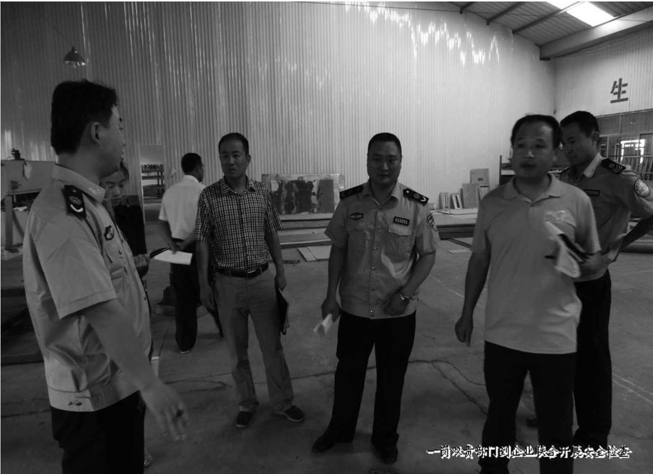
前一部门到企业联合开展安全检查