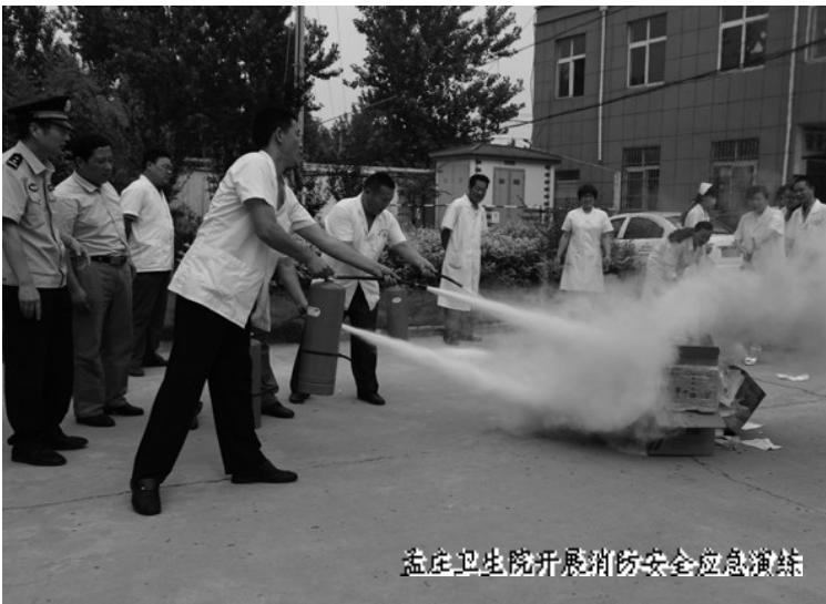
孟庄卫生院开展消防安全应急演练