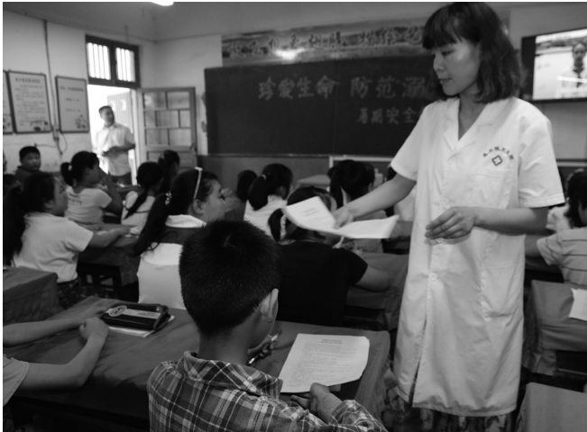
白衣天使送安全进校园