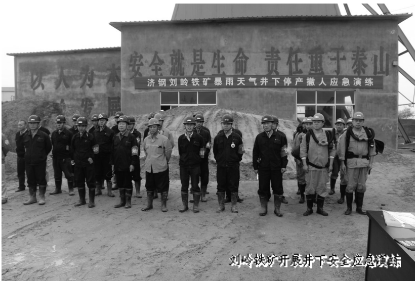
刘岭铁矿开展井下安全应急演练