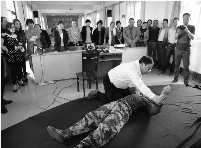
邀请红十字会专家开展应急培训