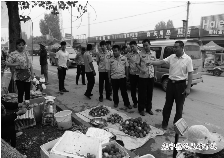
集中整治马路市场