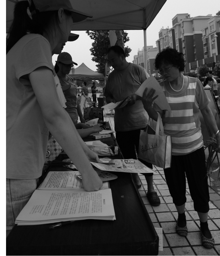
图为6月25日上午,曙光禁毒宣传志愿者服务队在人口密集的街口设置宣传站点,向市民广泛宣传禁毒法律法规及禁毒知识,进一步提高市民对毒品危害的认识,增强抵御毒品诱惑的能力。

□记者 郭丹 通讯员 王荣洪 韩东 本报讯 6月25日上午,曙光禁毒宣传志愿者服务队成立暨“珍爱生命 远离毒品”禁毒宣传教育活动在矿区街道北广场举行。市司法局副局长、市强制隔离戒毒所所长程海涛,枣庄经济开发区管委会副主任、区委政法委副书记、区司法局局长吴成旭出席活动。 活动仪式上,程海涛为活动仪式致词,并宣布全省首支曙光禁毒宣传志愿者服务队正式成立;吴成旭为志愿者服务队授旗;志愿者们代表呼吁全体市民“珍爱生命,远离毒品”,并号召志愿者自觉树立“防毒拒毒,从我做起”的主人翁精神,增强对于禁毒宣传工作的责任感和使命感,积极投身到禁毒斗争中来,当好禁毒的“宣传员”和“监督员”。 活动仪式后,曙光禁毒宣传志愿者服务队在人口密集的街口设置宣传站点,通过悬挂宣传横幅、制作宣传展板、张贴宣传海报、发放宣传单以及发送手机短信等形式,向市民广泛宣传《禁毒法》、《戒毒条例》等禁毒法律法规及禁毒知识,营造“依法禁毒、构建和谐”的浓厚氛围,让广大市民特别是广大青少年进一步加深对毒品危害的认识,增强抵御毒品诱惑的能力。活动现场的大型宣传展板吸引了许多市民前来参观、咨询,100名志愿者走上街头,详细解答群众关于禁毒知识咨询,向过往群众发放禁毒宣传资料。活动现场还开展向社会公开招聘禁毒志愿者活动,不少热心群众现场踊跃报名,参加到志愿者队伍中来,现场招募志愿者47人,使我区反毒、拒毒、禁毒的有生力量不断壮大。 据了解,目前志愿者服务队已招募志愿者226名。下一步他们将深入辖区不同领域,广泛开展禁毒宣传教育“进学校、进社区、进单位、进工厂、进农村、进场所”的六进活动,积极营造“依法禁毒、构建和谐”的浓厚氛围。 据统计,当日活动现场共展出宣传展板9块,悬挂横幅6条,张贴禁毒宣传海报近百张,发放禁毒宣传资料1800余份,解答群众咨询160余人次,受到广大市民欢迎。